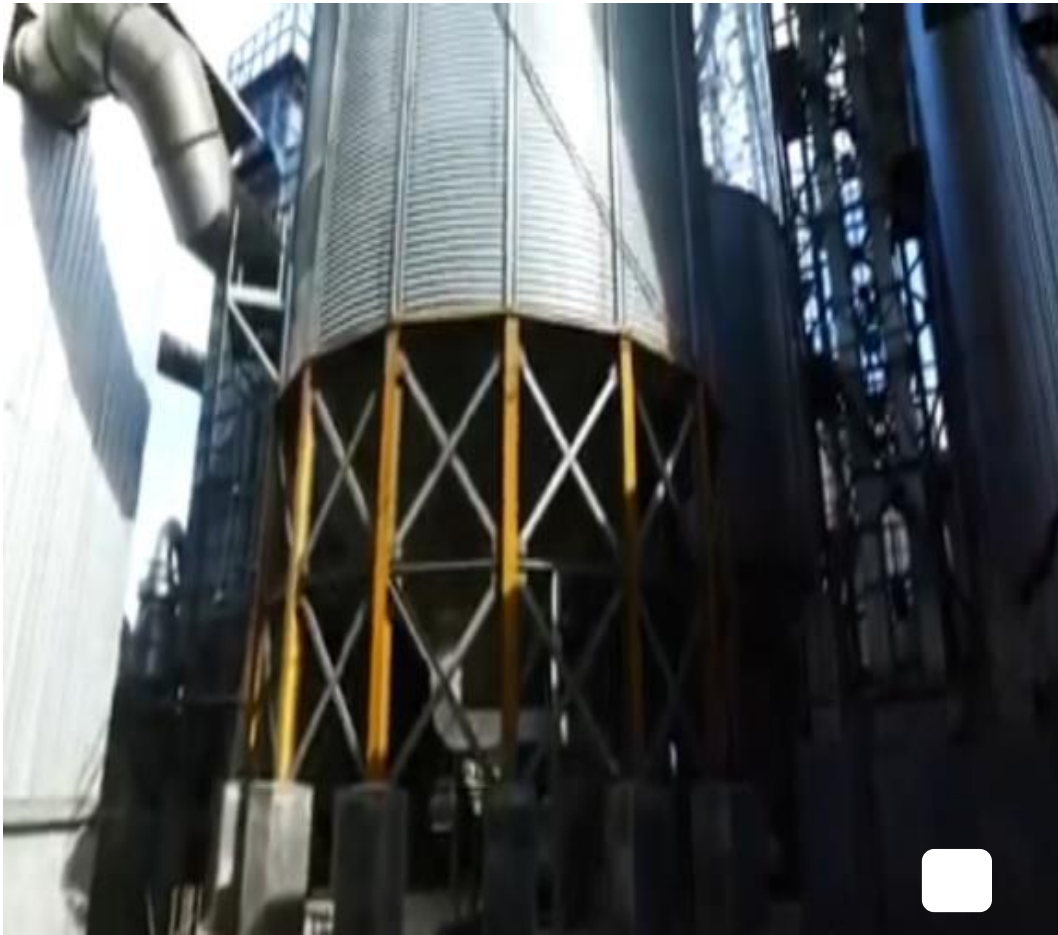
Foto Mesin Dryer / Pengering Jagung