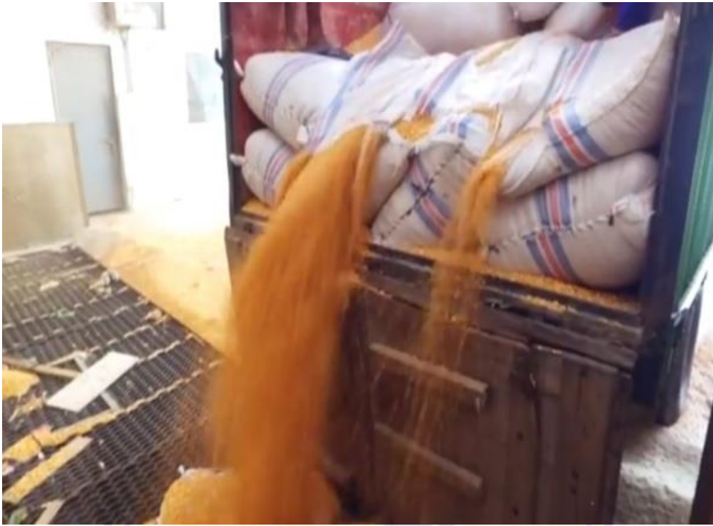
Foto Pembongkaran Jagung oleh PT. SAN Kabupaten Dompu