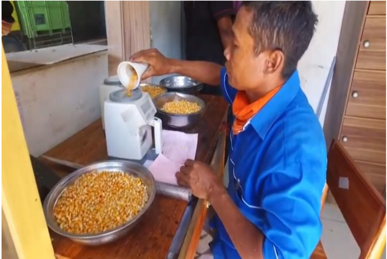
Foto Proses Pengetesan Kadar Air Jagung