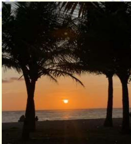
Suasana sore hari Pantai Maluk, 2023