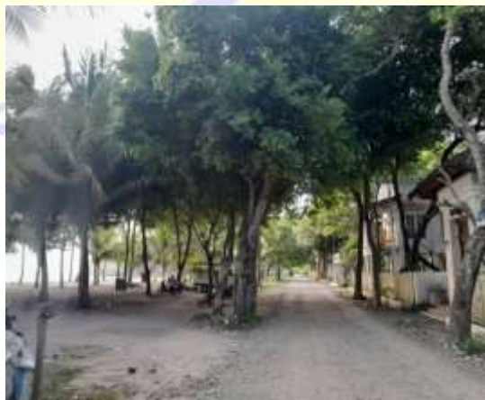
Kondisi jalan di Pantai Maluk, 2023