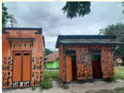
kondisi toilet umum di Pantai Maluk, 2023