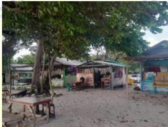
Warung yang ada disekitar Pantai Maluk, 2023