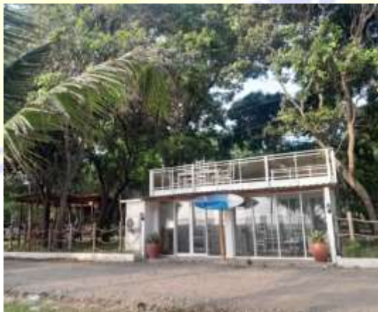
Dokumentasi Pribadi: Salah satu homestay yang ada di sekitar Pantai Maluk, 2023