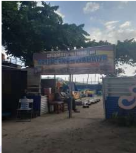
Dokumentasi Pribadi: Wahana permainan anak-anak, 2023