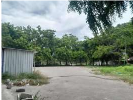
situasi parkir Pantai Maluku, 2023