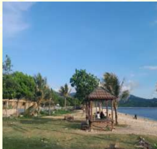
Dokumentasi Pribadi: kondisi gazebo yang ada di Pantai Maluk, 2023