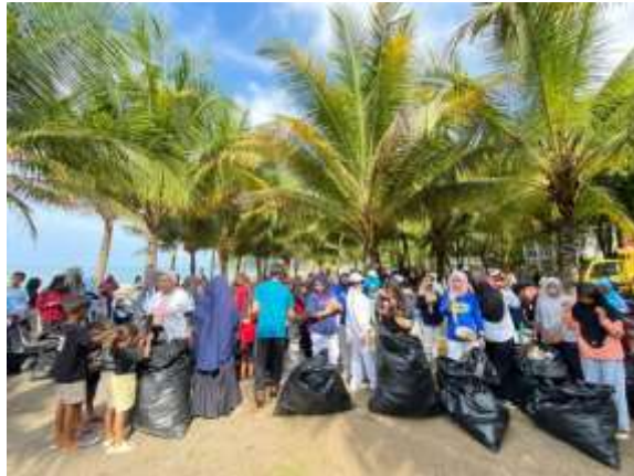
Dokumentasi : Beach Clean Up Pantai Maluk, 2023