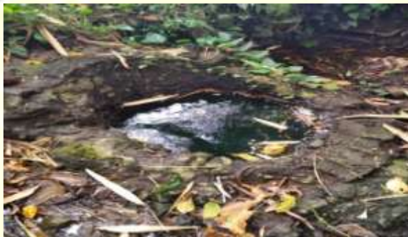
Gambar: Mata Air Dusun Jempong Eler