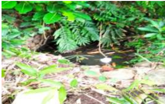
Gambar: Mata Air Dusun Mertak Tombok