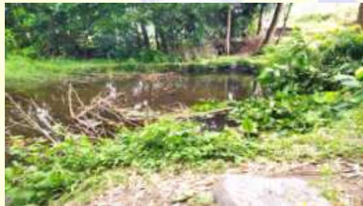
Gambar: Mata Air Dusun Mertak Tombok