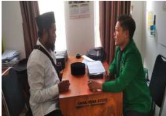
Gambar: Wawancara Dengan Kepala Dusun Kepok

Sumber : Dokumentasi penulis Dokumentasi Peneliti pada tanggal 24 April 2023 di Kantor desa Mertak Kepok