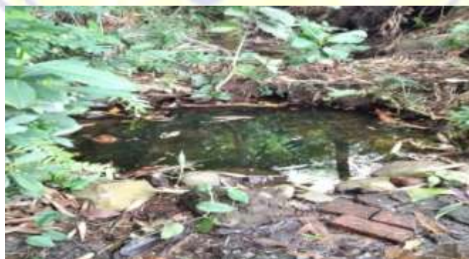
Gambar: Mata Air Dusun Mertak Umbak