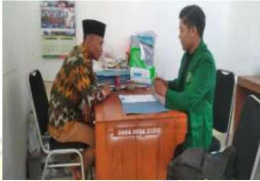
Sumber : Dokumentasi Peneliti pada tanggal 24 April 2023 di Kantor desa Mertak Tombok