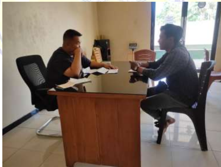
Keterangan : Wawancara bersama manager PT Sinar agro gemilang indah dan kepala desa banggo