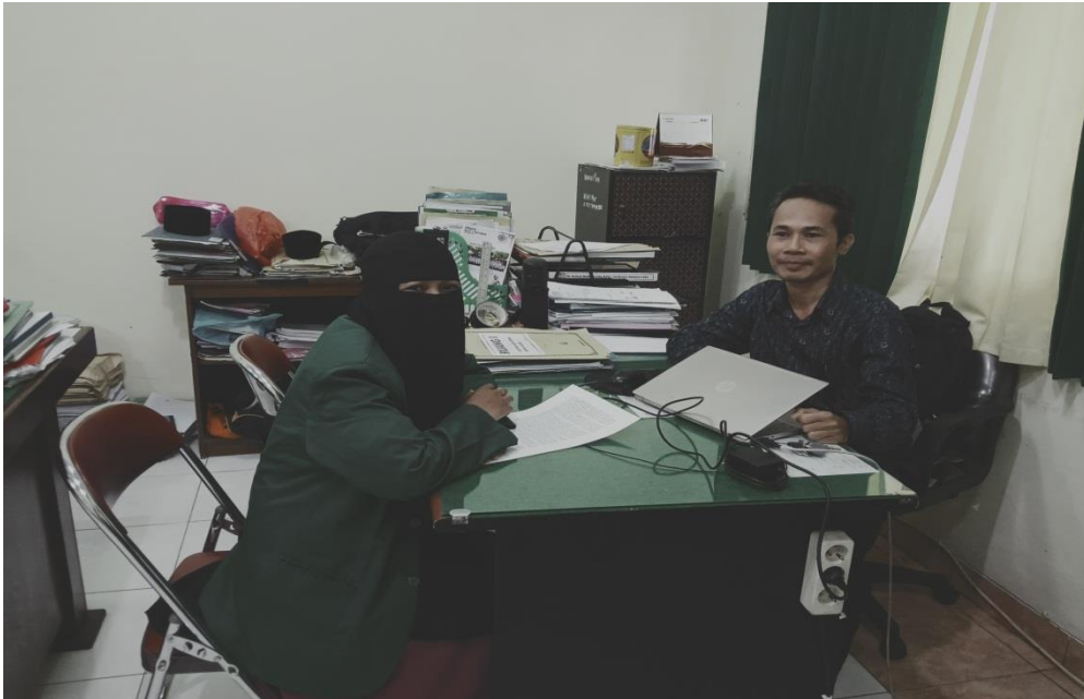
Wawancara bersama waka kurikulum