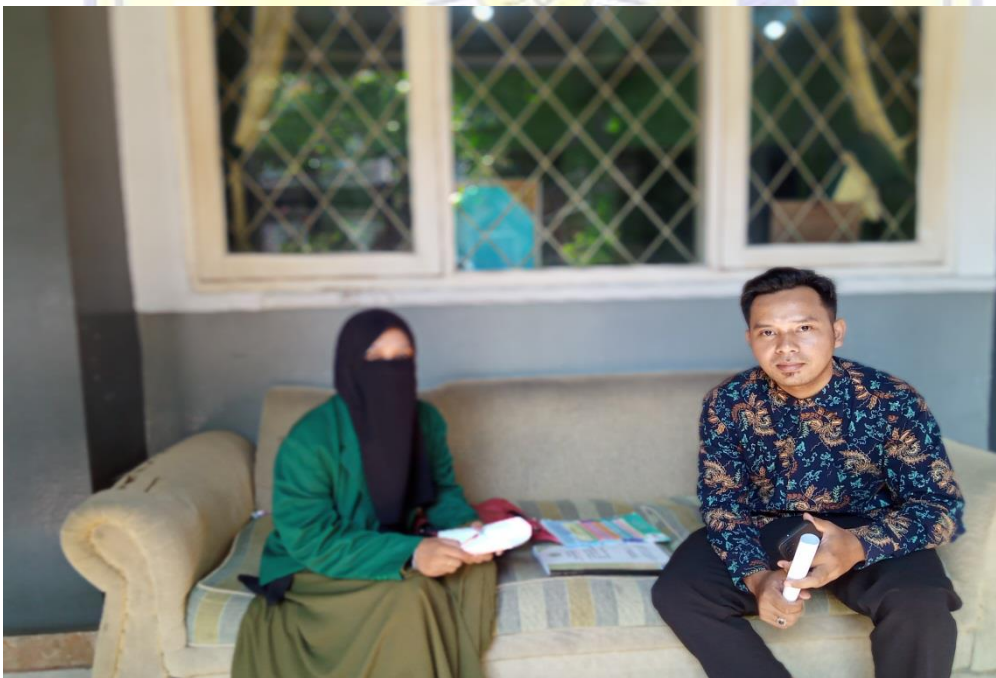
Wawancara bersama guru bahasa arab