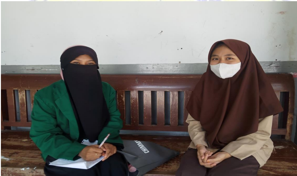
Wawancara bersama siswa