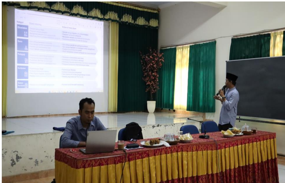
Bimtek Implementasi Kurikulum Merdeka Mts Negeri 1 Mataram Tahun Ajaran 2022/2023