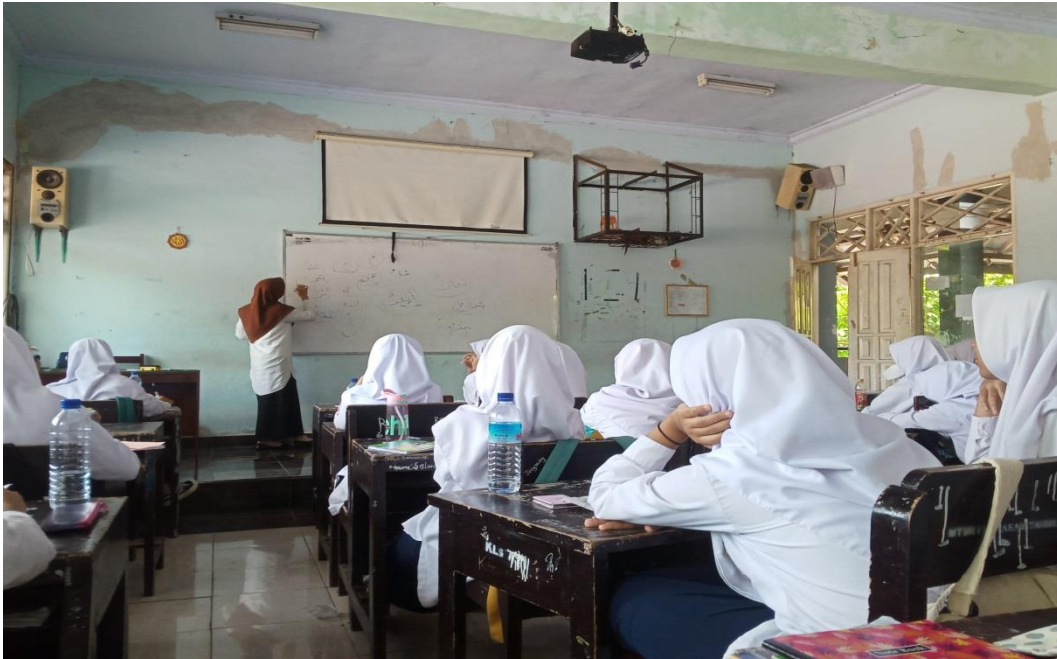
Kegiatan belajar mengajar mts negeri 1 mataram