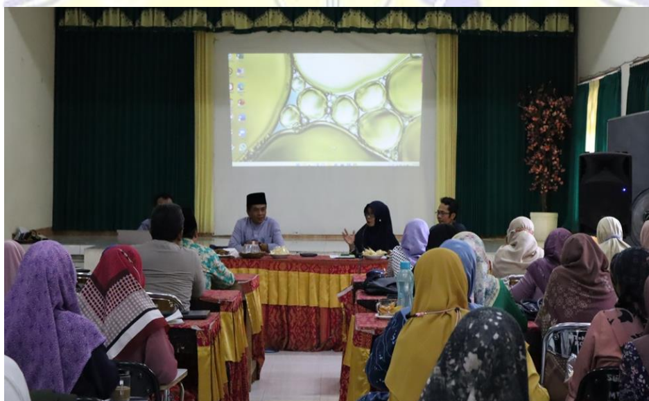
Bimtek Implementasi Kurikulum Merdeka Mts Negeri 1 Mataram Tahun Ajaran 2022/2023