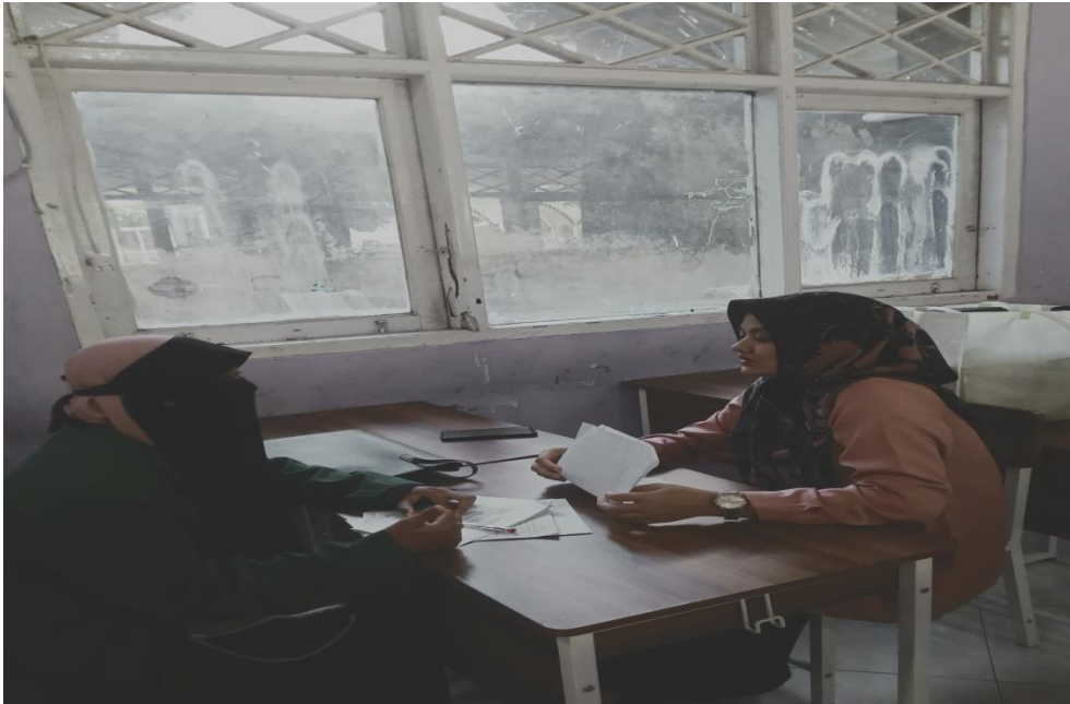
Wawancara bersama guru bahasa arab