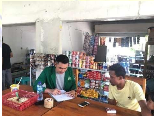
Dokumentasi dengan pedagang di sekitar objek wisata air terjun.