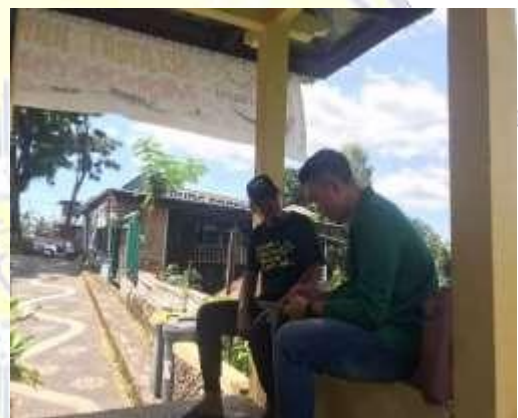
Dokumentasi Wawancara dengan Manajer BUMDes Unit Usaha Desa Wisata di Desa Senaru, Kecamatan Bayan, Kabupaten Lombok Utara.