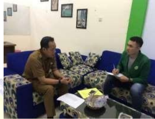
Dokumentasi Wawancara dengan Kepala Bidang Pemasaran Dinas Pariwisata Kabupaten Lombok Utara