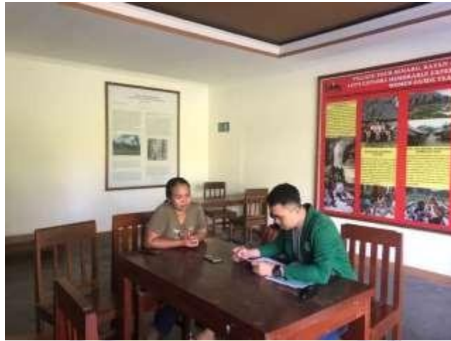
Dokumentasi dengan anggota kelompok women Guide