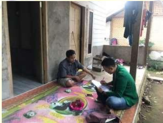
Dokumentasi dengan masyarakat di Desa Senaru