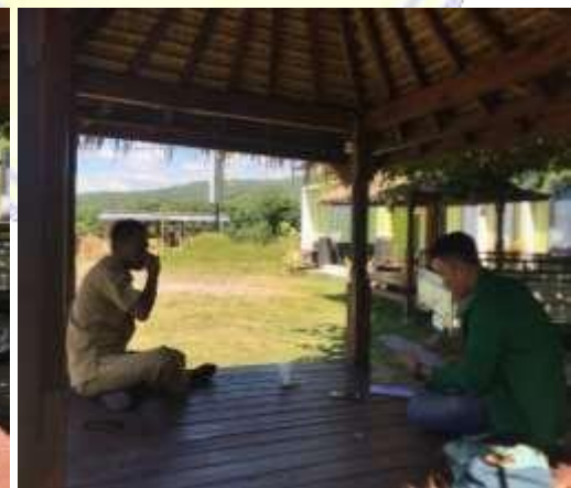
Dokumentasi Wawancara dengan Perangkat Desa Kasi Pemerintahan di Desa Senaru, Kecamatan Bayan, Kabupaten Lombok Utara