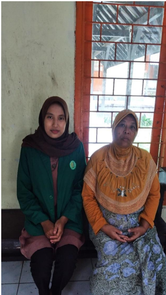
Gambar.13 Wawancara dengan R (Jum'at 09 Desember 2022 )