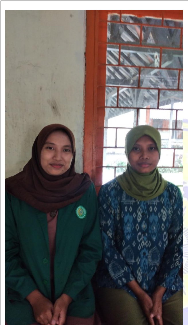
Gambar.15 Wawancara dengan SW (Minggu 11 Desember 2022 )