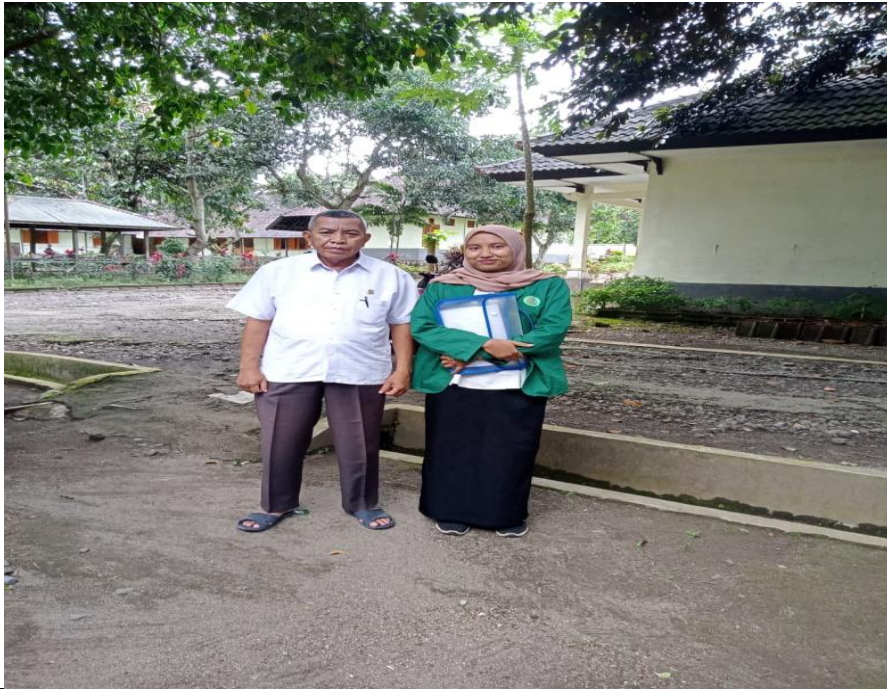
Gambar.3 Wawancara dengan Suharto ( Rabu, 14 Desember 2022 )