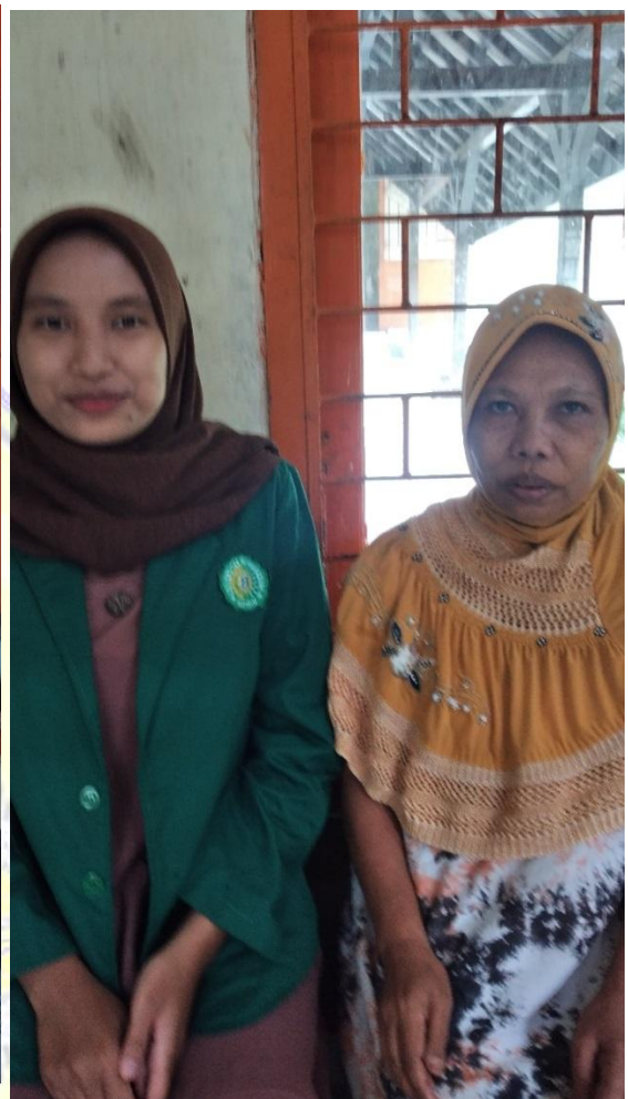
Gambar.14 Wawancara dengan I (Jum'at 09 Desember 2022 )