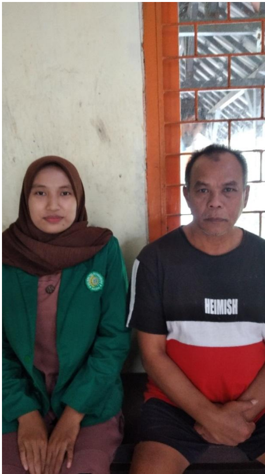
Gambar.11 Wawancara dengan K (Jum'at 09 Desember 2022 )