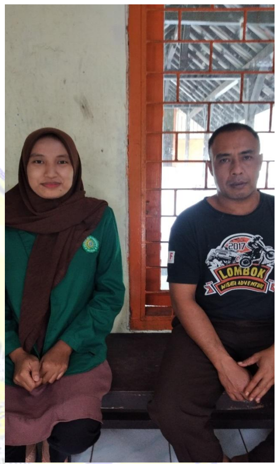
Gambar.12 Wawancara dengan EK (Jum'at 09 Desember 2022 )