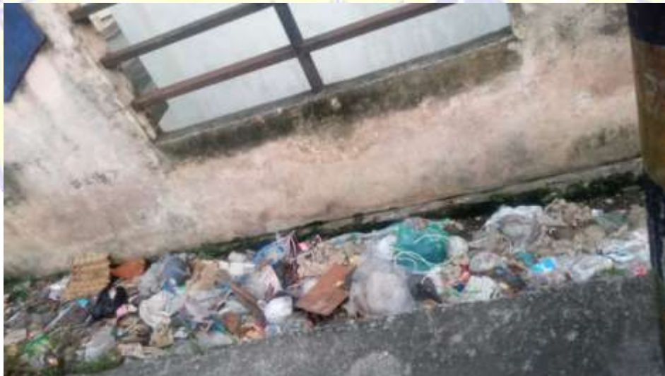
Doc. Penumpukan sampah di selokan