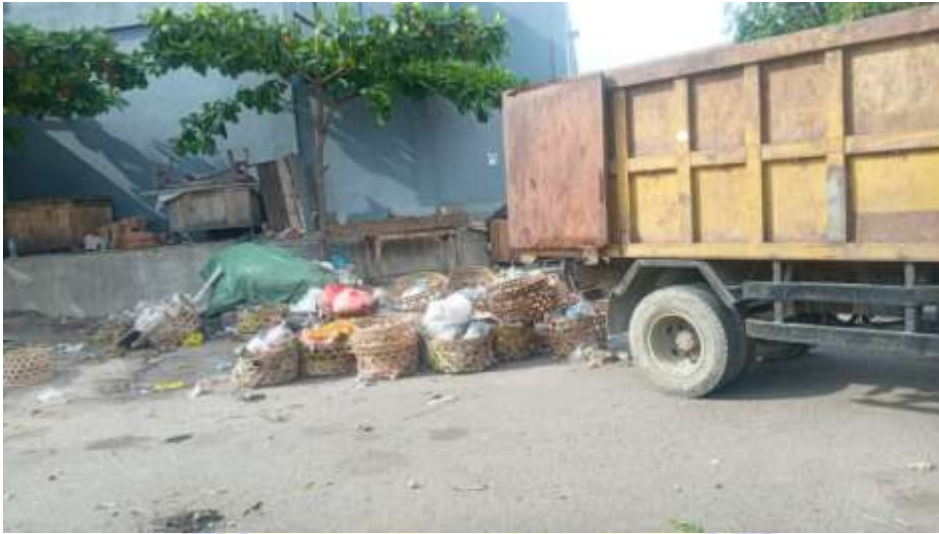
Doc. pengangkutan sampah dari Tempat Pembuangan Sampah sementara