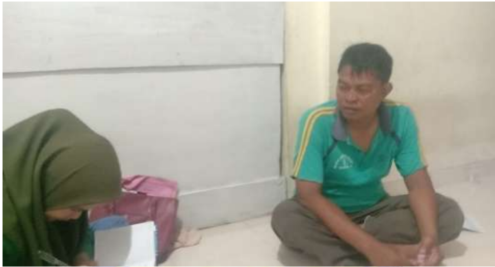
Wawancara dengan Bpk Putra selaku masyarakat Pagesangan