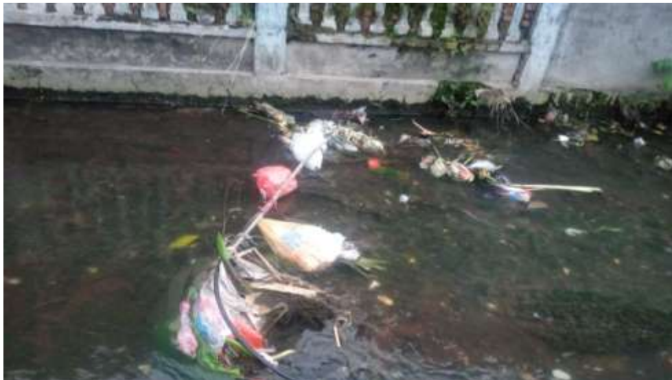
Doc. Sampah di selokan