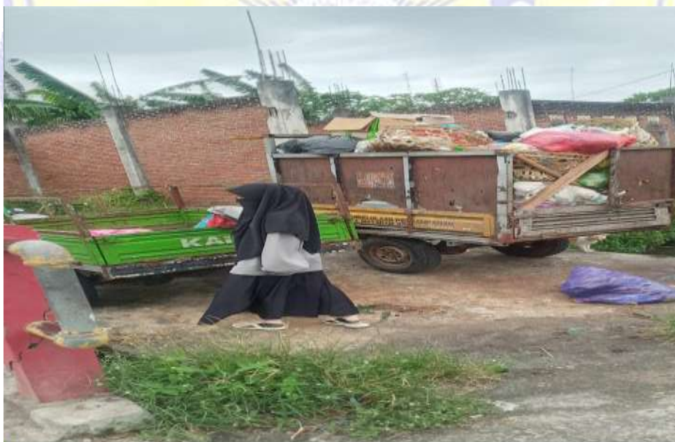
Doc. Tempat Pembuangan Sampah Sementara