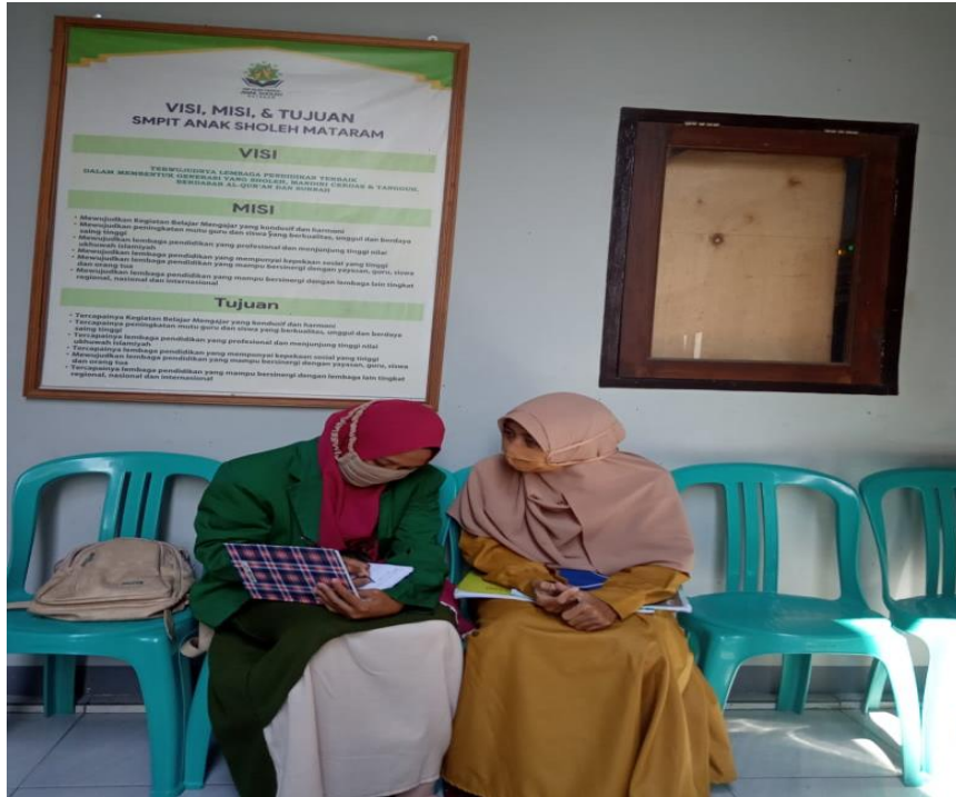
التعليم بعد كوفيد (وجه بوجه)