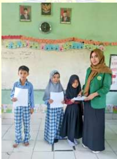
Dokumentasi penyerahan lembar angket pada peserta didik kelas 2.