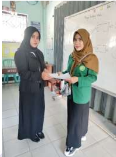
Dokumentasi penyerahan lembar angket dan wawancara kepada wali kelas 5.