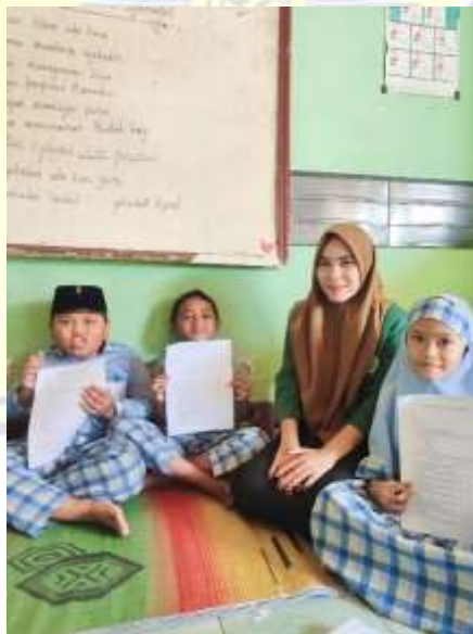
Dokumentasi penyerahan lembar angket pada peserta didik kelas 3.