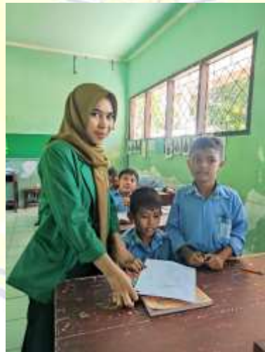
Dokumentasi penyerahan lembar angket pada peserta didik kelas 1.