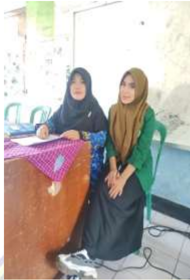
Dokumentasi penyerahan lembar angket dan wawancara kepada wali kelas 6.