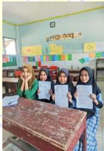
Dokumentasi penyerahan lembar angket pada peserta didik kelas 6.