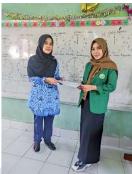
Dokumentasi penyerahan lembar angket dan wawancara kepada wali kelas 2.