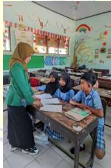
Dokumentasi penyerahan lembar angket pada peserta didik kelas 5.