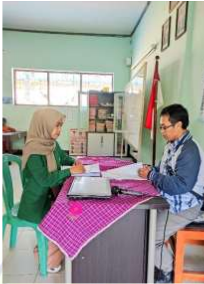
Dokumentasi penyerahan lembar angket dan wawancara kepada wali kelas 4.