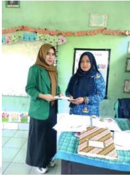
Dokumentasi penyerahan lembar angket dan wawancara kepada wali kelas 1.