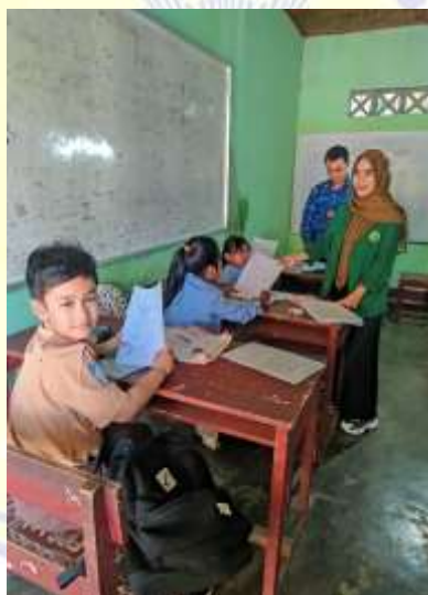
Dokumentasi penyerahan lembar angket dan wawancara pada guru mapel PAH..