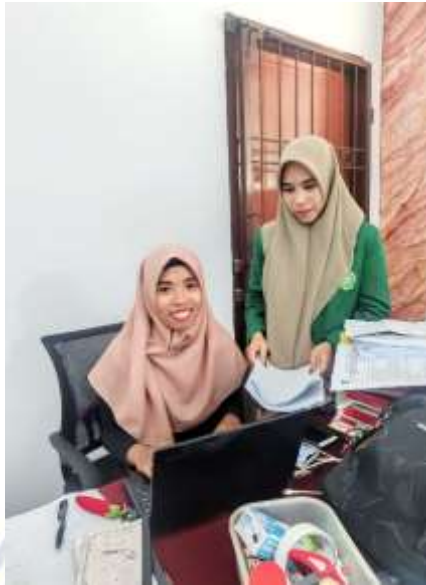
Dokumentasi penyerahan lembar angket dan wawancara kepada wali kelas 3.