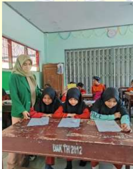
Dokumentasi penyerahan lembar angket pada peserta didik kelas 4.