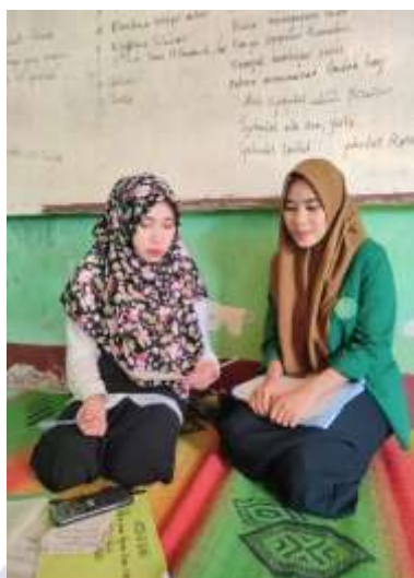
Dokumentasi penyerahan lembar angket dan wawancara pada guru mapel PAI.