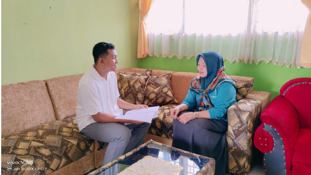
Wawancara Kepala Sekolah dan Guru kelas