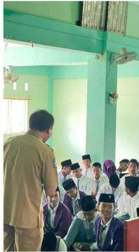
Sosialisasi Pemerintah Desa Beleke dalam pencegahan nikah usia dini di ponpes ass-hoowah Alislamiyah Desa Deleke Kecamatan Gerung