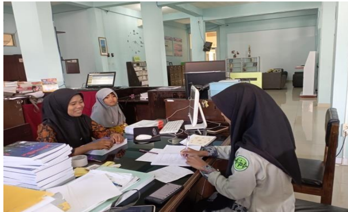
Wawancara bersama pustakawan