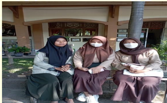
Wawancara bersama siswa