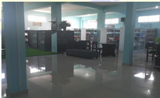
Perpustakaan SMA Negeri 2 Mataram