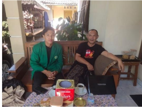
Gambar 3. Foto wawancara dengan sekretaris PDM Lombok Timur