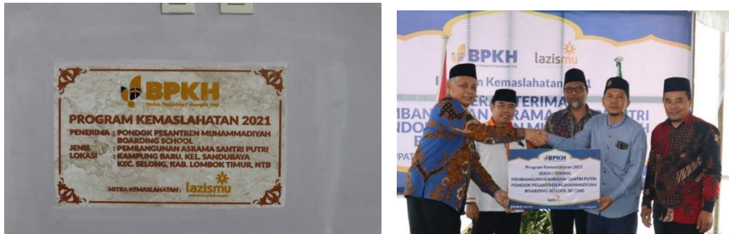
Gambar 5. Foto serah terima Pembangunan Asrama santri Putri Pondok pesantren muhammadiyah boarding school selong lombok timur bersama BPKH DAN LAZISMU.