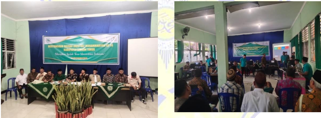
Gambar 6. Rapat musyawarah pemilihan ketua pimpinan daerah muhammadiyah lombok timur