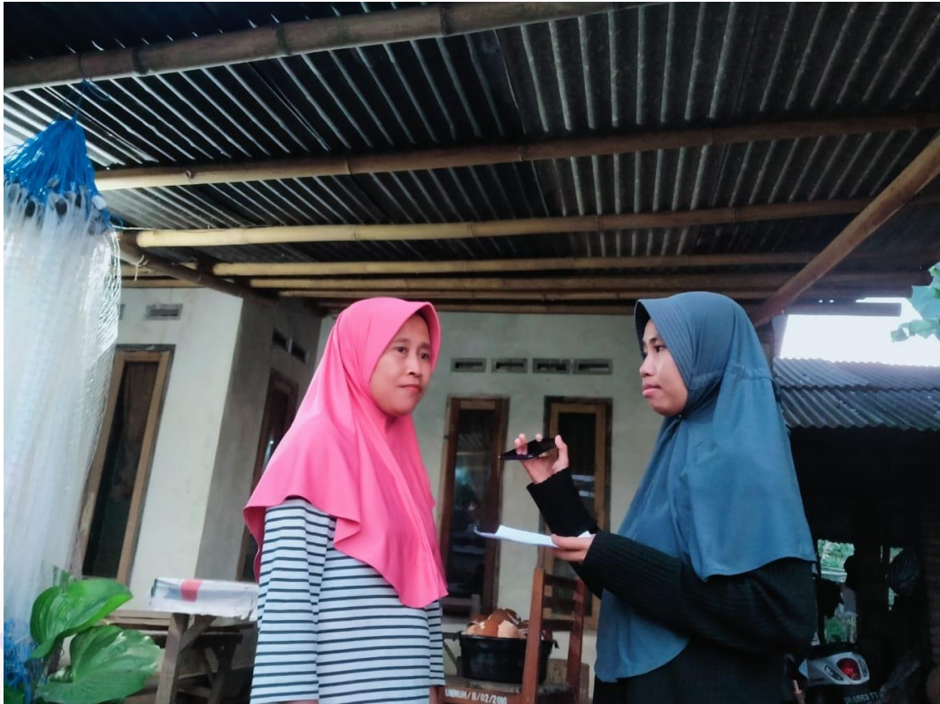
Wawancara Orang tua korban, Gambar 6