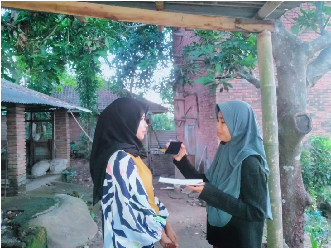
Wawancara korban, Gambar 4