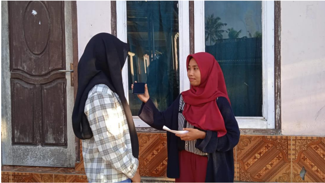
Wawancara cara korban, Gambar 1