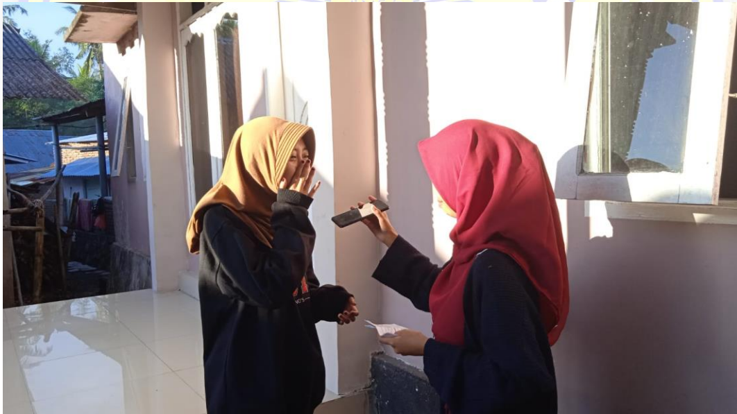
Wawancara cara korban, Gambar 2