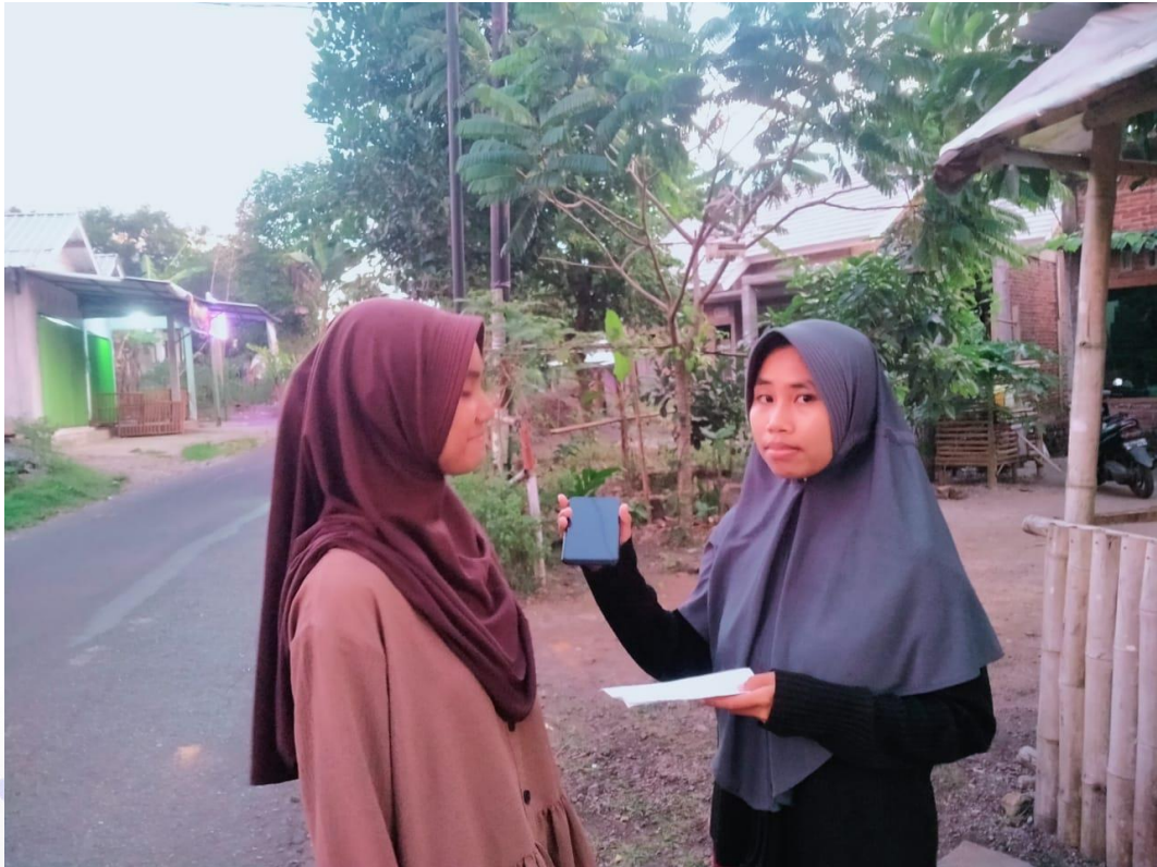
Wawancara korban, Gambar 5