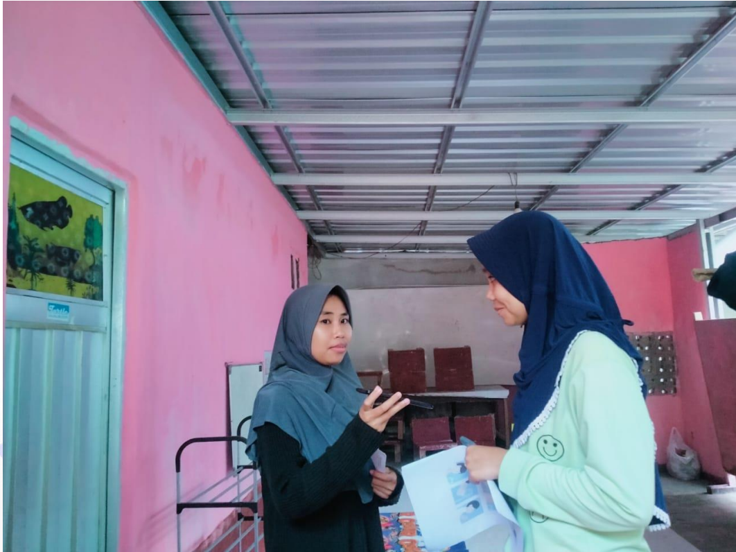
Wawancara korban, Gambar 3