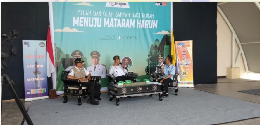
Gambar 2.6 Dialog