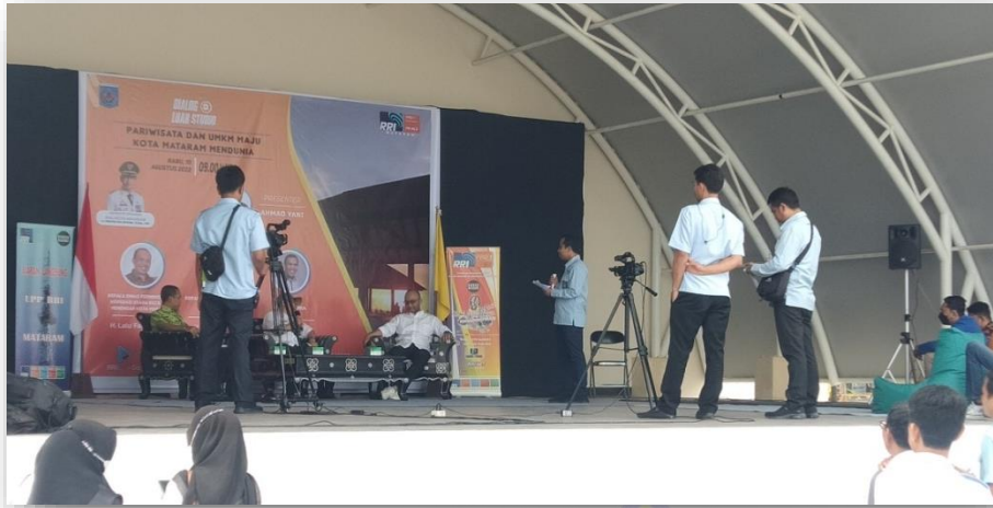
Gambar 2.5 Pengawasan Dialog