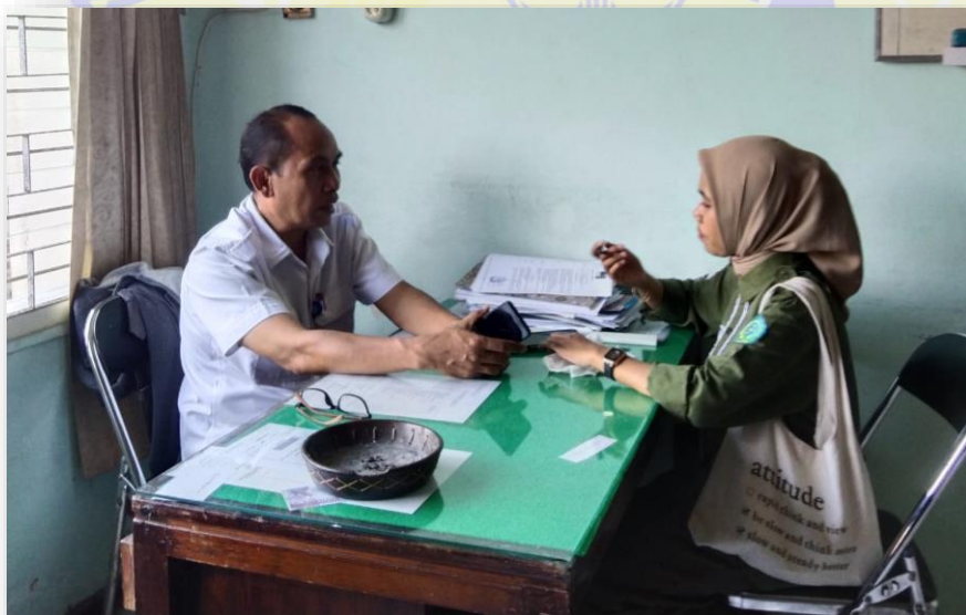
Gambar 2.8 Wawancara operator siaran dialog kentongan