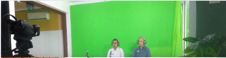
Gambaftr 2.3 Narasumber Dialog Kentongan