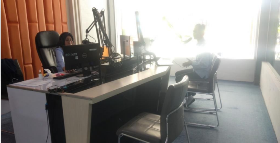
Gambar 2.4 Presenter yang bertugas dalam dialog kentongan