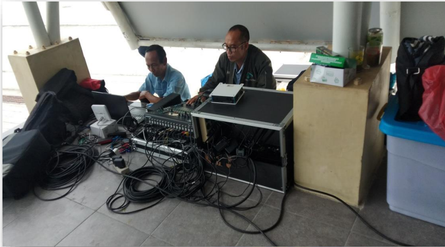
Gambar 2.7 Pengawasan persiapan sarana prasarana