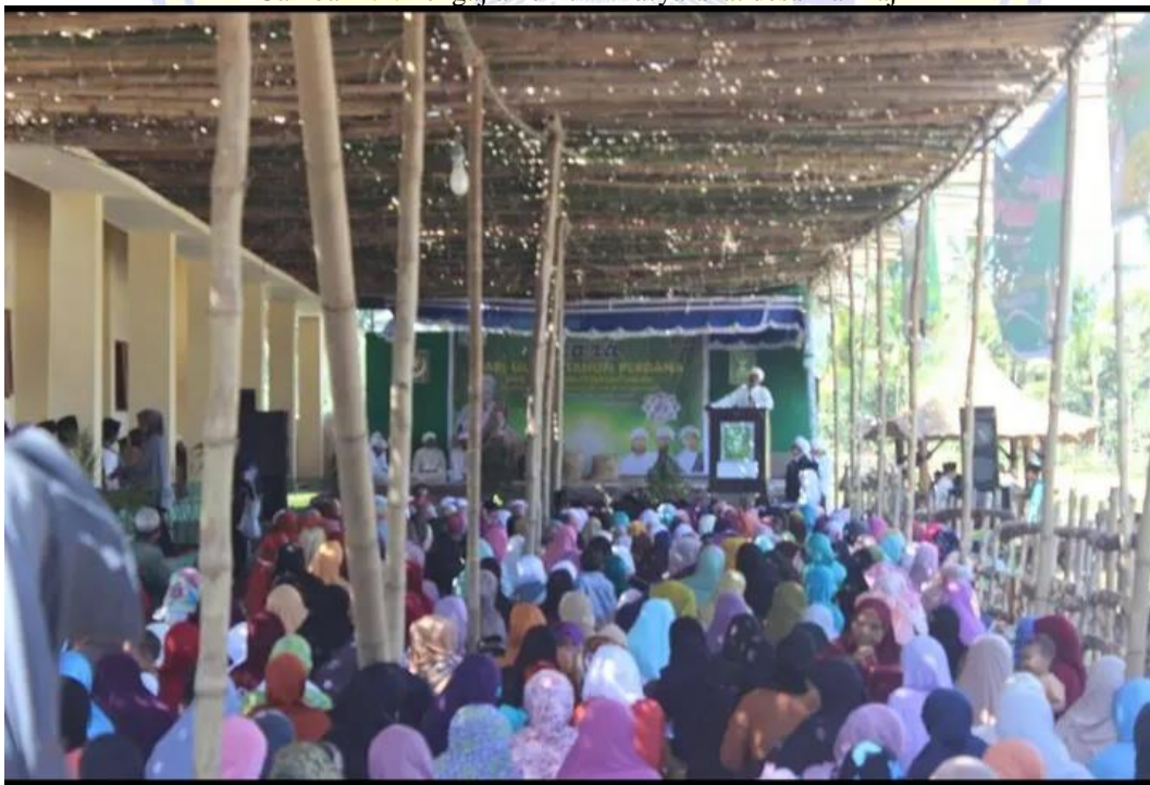
Gambar 1.2: Pengajian umum masyarakat desa Darmaji.