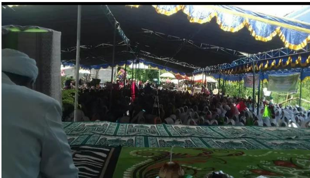
Gambar 1.3: Pengajian umum di Pondok Pesantren Nurul Mubin.