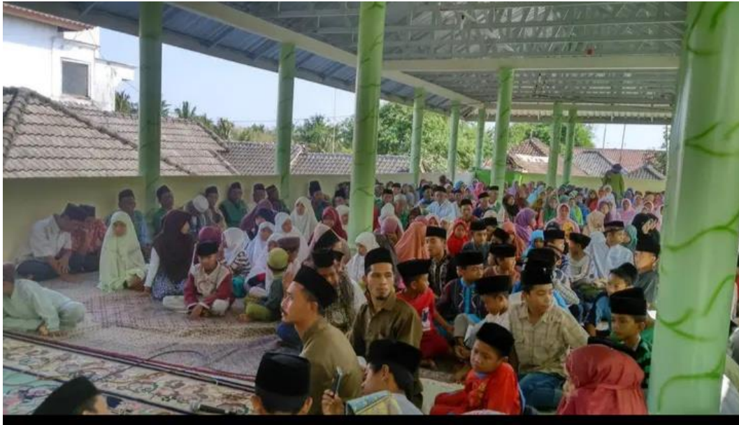
Gambar 1.1: Pengajian umum masyarakat desa Darmaji