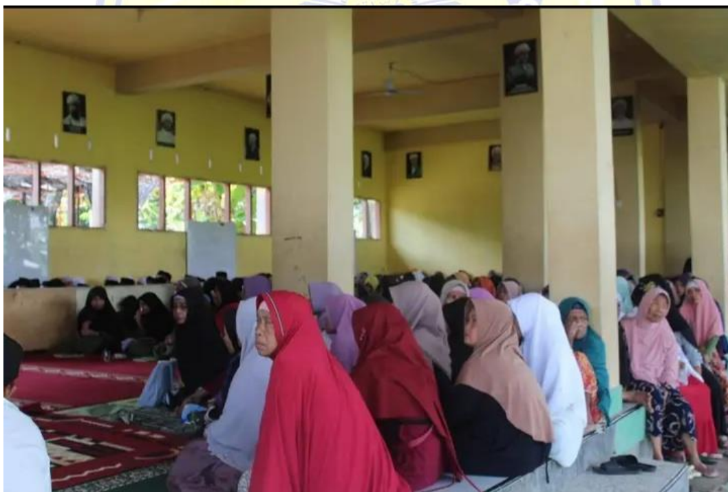
Gambar 1.4: Pengajian umum masyarakat desa Darmaji.