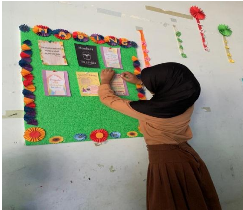
Siswa memasang hasil karyanya di mading