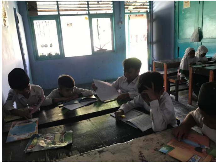
5. Kegiatan membaca buku di perpustakaan