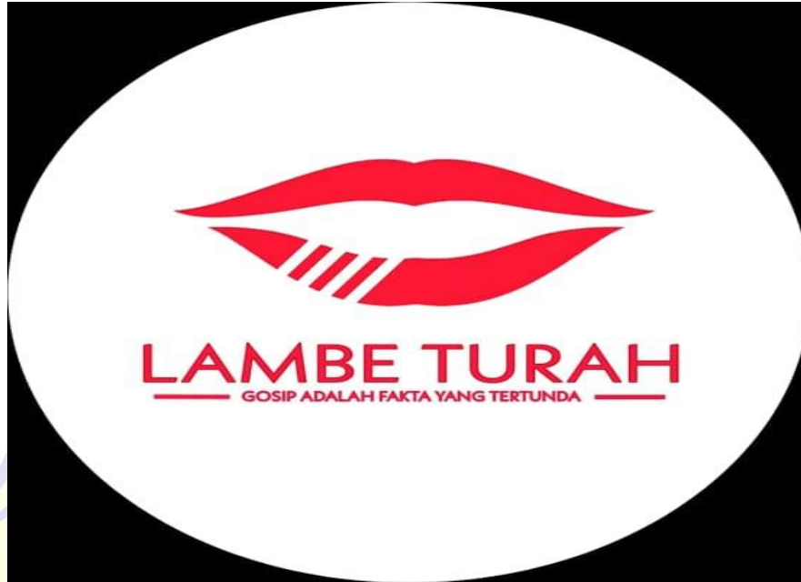
Lampiran Gambar 2 Profil Akun Instagram @Lambe_Turah