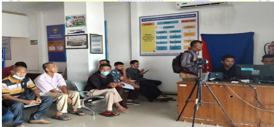
Gambar 6.9 Ruang Tunggu Kantor Dupcapil Dompu