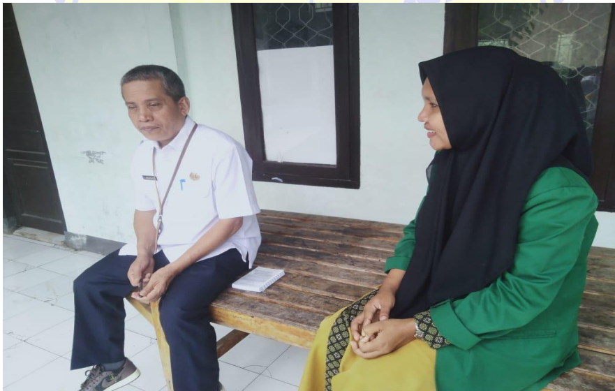
Gambar 6.2 wawancara dengan Kepala Dinas Dupcapil Kabupaten Dompu