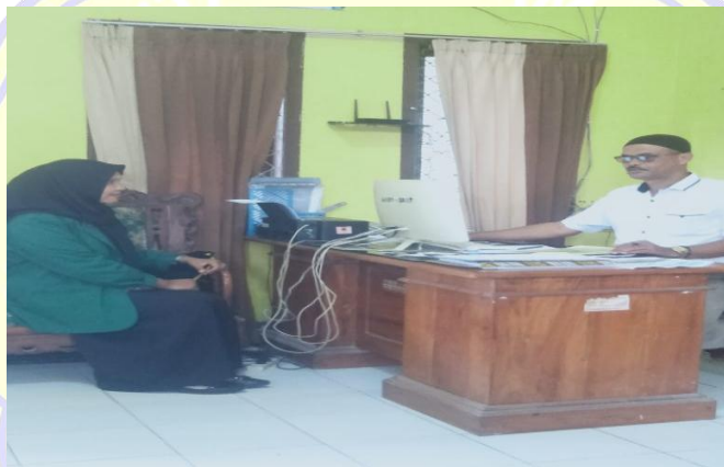
Sumber : Diolah oleh peneliti (13 februari 2023)