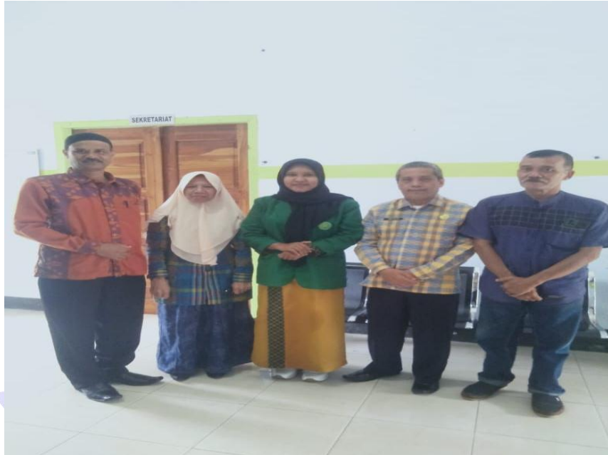
Gambar 6.1 foto bersama petugas Dupcapi Kabupaten Dompu