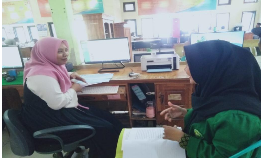
Sumber : Diolah oleh penelitian (13 february 2023)