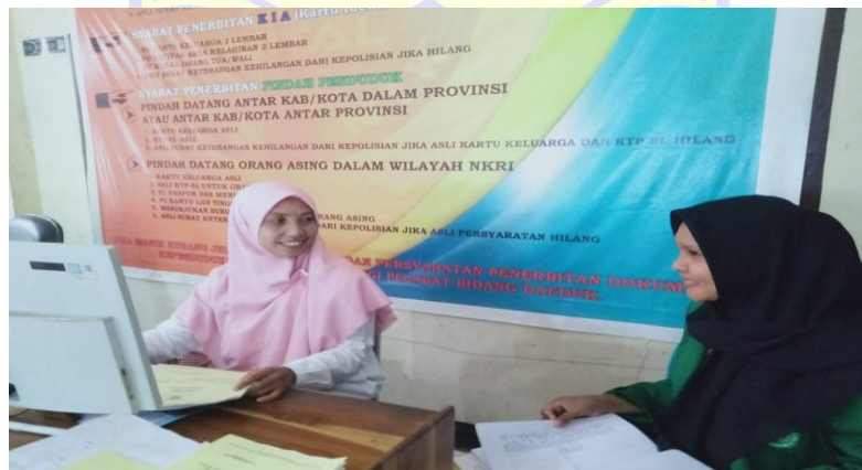
Sumber : Diolah oleh peneliti (27 februari 2023)