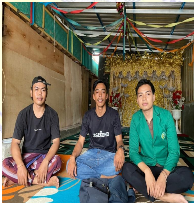
Wawancara dengan Pengawas (BUMDes) dan Ketua Karnag Taruna Desa Rempe