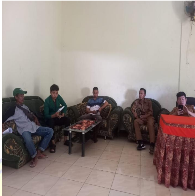
Bersama Dengan Kepala Desa Rempe , Ketua, dan pengurus Badan Usaha Milik Desa (BUMDes) Mampes Rungan