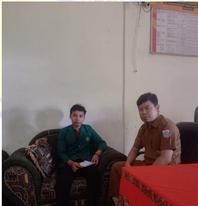
Wawancara Dengan Pengurus Badan Usaha Milik Desa (BUMDes) Mampes Rungan