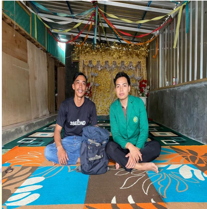
Wawancara Dengan Ketua Karang Taruna Desa Rempe