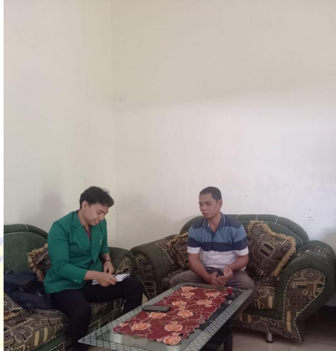
Wawancara Dengan kepala Desa Rempe