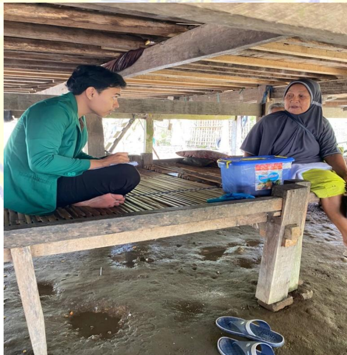
Wawancara Dengan Masyarakat Sekaligus Anggota Dari Unit Usaha Simpan Pinjam