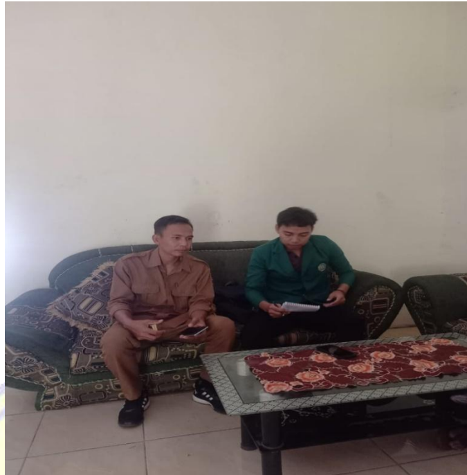
Wawancara Dengan Pengurus Badan Usaha Milik Desa (BUMDes) Mampes Rungan