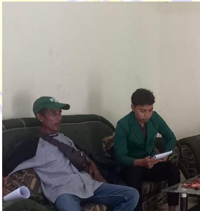
Wawancara Dengan Ketua Badan Usaha Milik Desa (BUMDes) Mampes Rungan