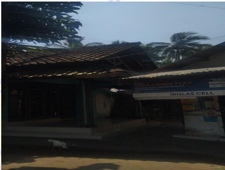
Rumah salah satu masyarakat miskin