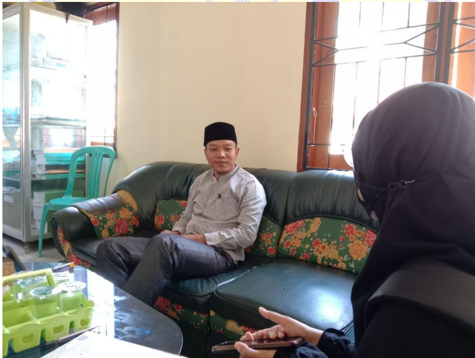
Wawancara kepada kepala desa