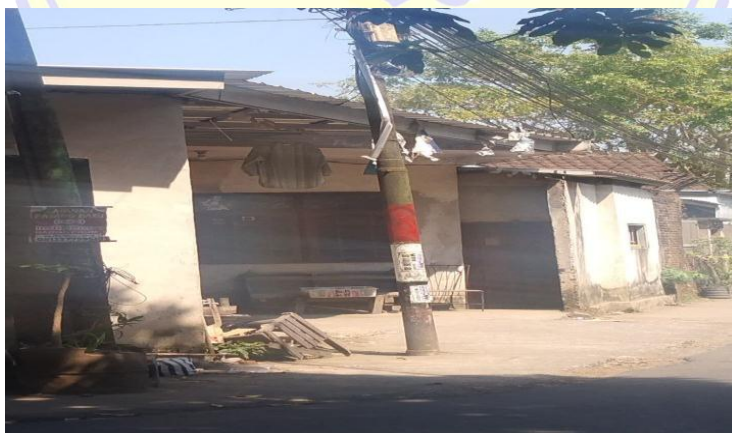
Rumah salah satu masyarakat miskin