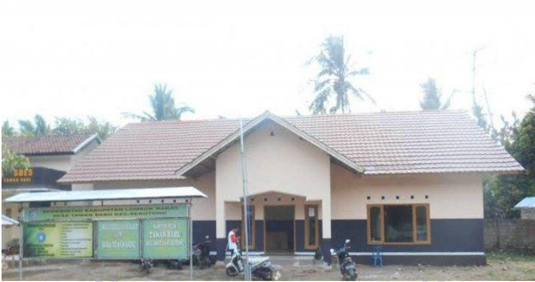
Gambar depan kantor desa