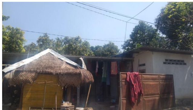
Rumah salah satu masyarakat miskin