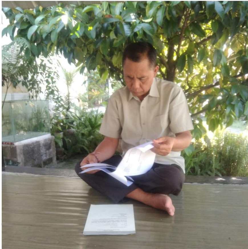
UN AH Responden