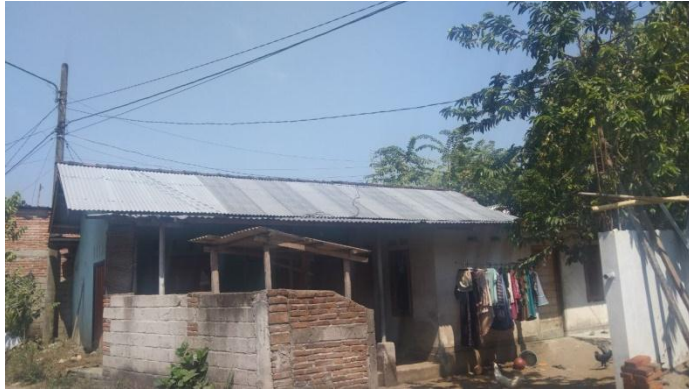
Rumah salah satu masyarakat miskin