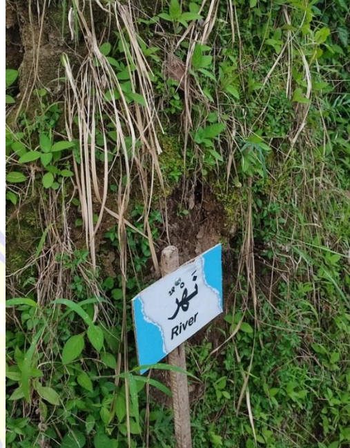
١.١ منشور المفردات