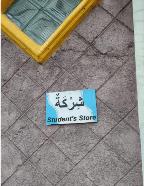
١.٢ منشور المفردات