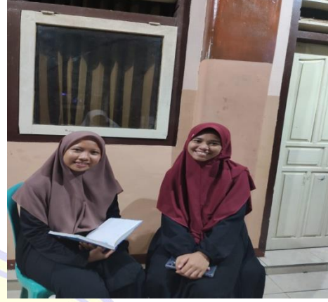
١٠١٠ المقابلة مع المشرفة اللغة