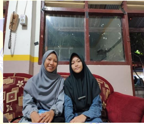
١٠١٢ المقابلة مع قسم اللغة