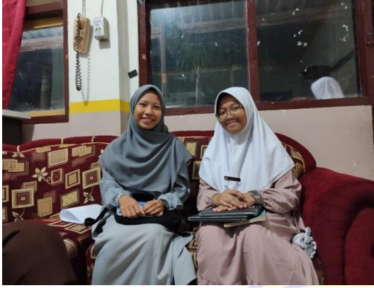
١٠١١ المقابلة مع قسم اللغة