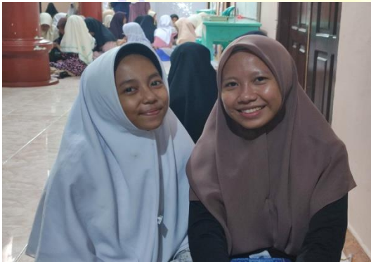
١٠١٤ المقابلة مع الطالبة