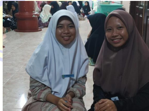
١٠١٤ المقابلة مع الطالبة