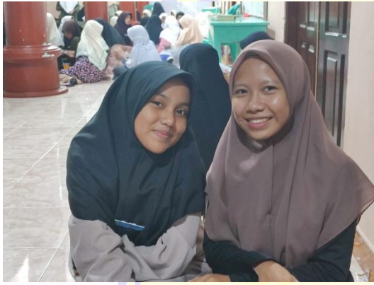
١٠١٣ المقابلة مع الطالبة