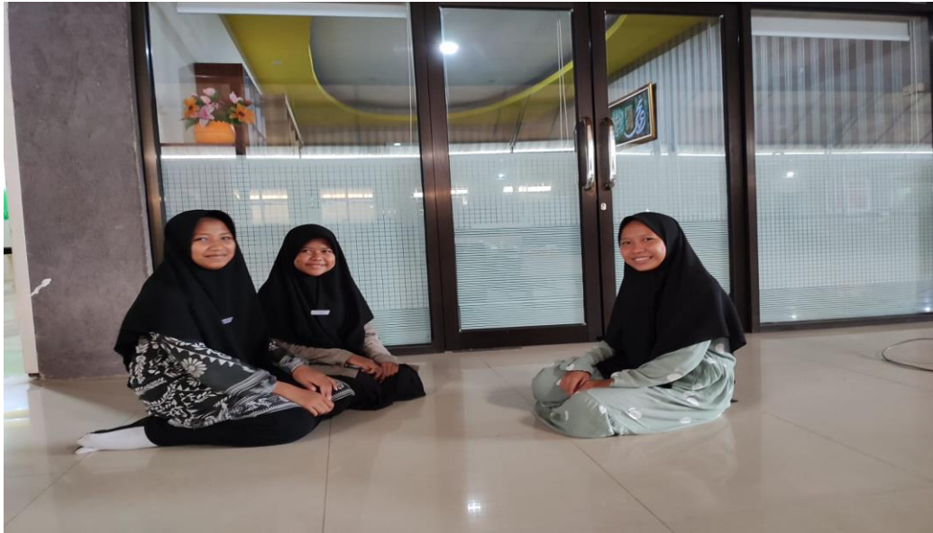
١٠١٥ المقابلة مع الطالبة