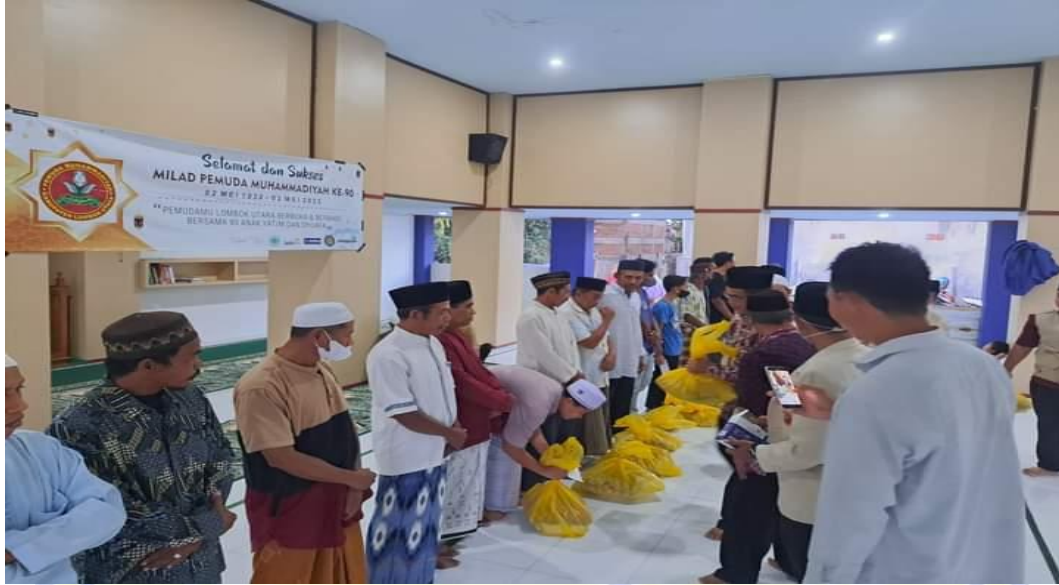
Kegiatan Berbagi Sembako Terhadap Masyarakat