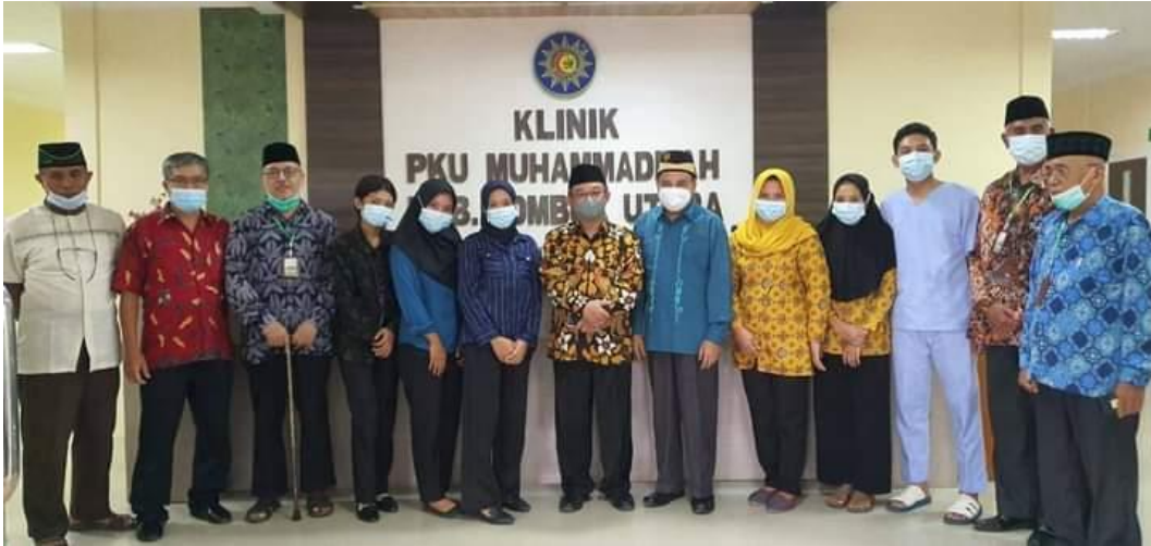
Kegiatan Jum'at Bekah Dengan Pemeriksaan Kesehatan Geratis