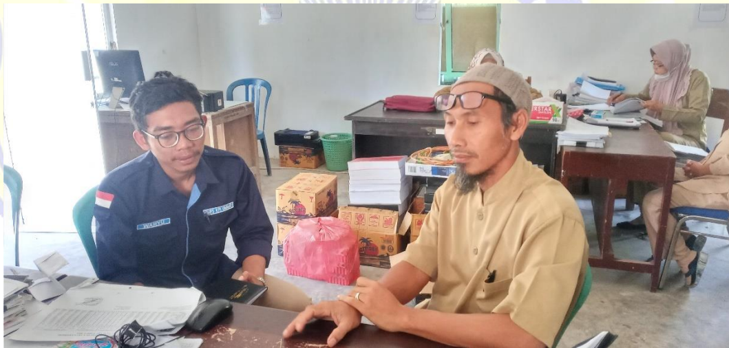
Wawancara Bersama Sekertaris Desa Gondang.