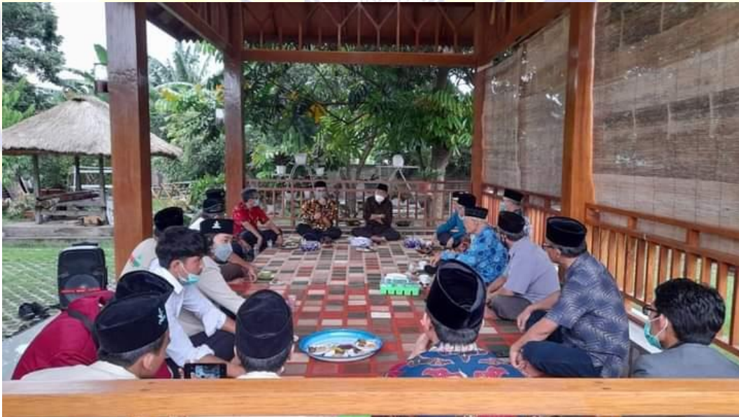
Kajian Bulanan Pemuda Muhammadiyah KLU