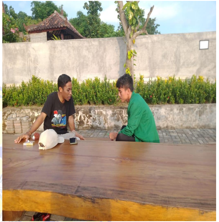
Dokumentasi Ketua Pokdarwis