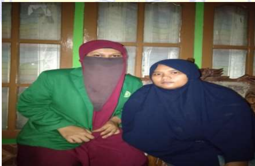
Lampiran 5 wawancara dengan Ibu Ros Tanggal 15 Mei 2022