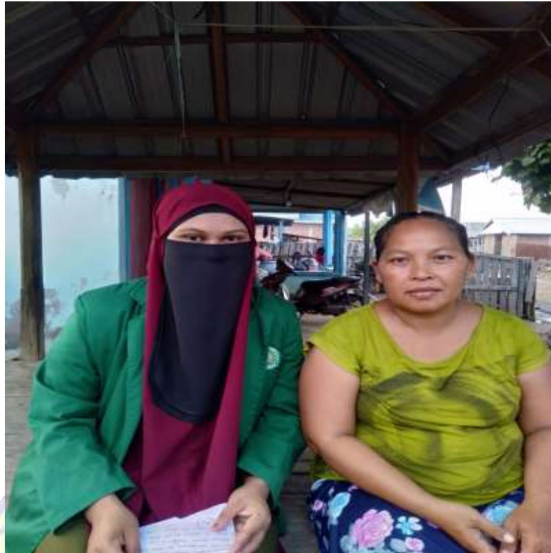
Lampiran 14 wawancara Ibu Kus tanggal 19 Mei 2022