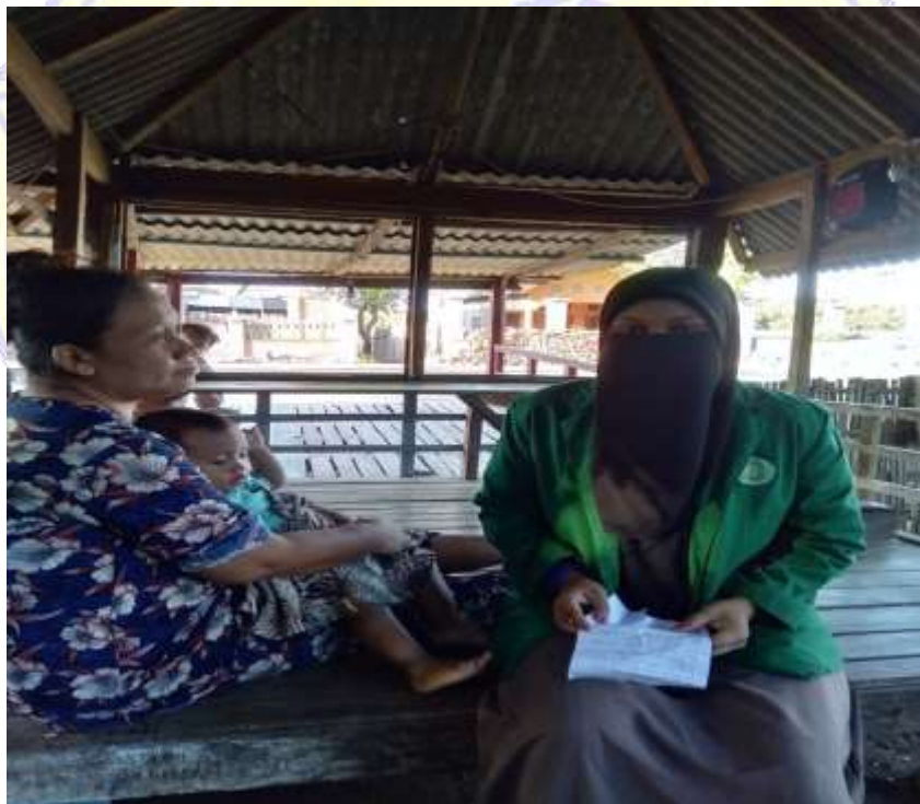
Lampiran 17 wawancara Ibu Ayu tanggal 14 Mei 2022