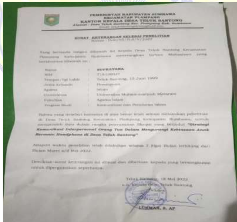
Lampiran 2 Surat keterangan selesai Penelitian