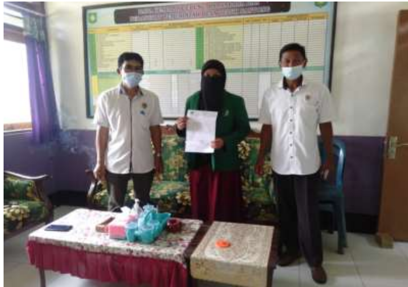
Lampiran 1 foto bersama Kepala Desa dan Kadus Desa Teluk Santong