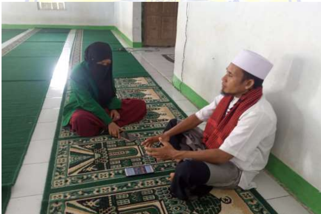
Lampiran 7 wawancara dengan Ustadz Imam