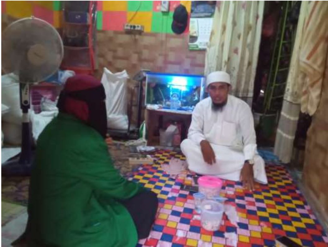
Lampiran 2 wawancara dengan Ustadz Khoru Rahma