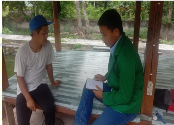
Wawancara dengan bapak Pahari selaku RT di Lingkungan Ramat Nunggal