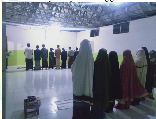
Kegiatan sholat berjamaah