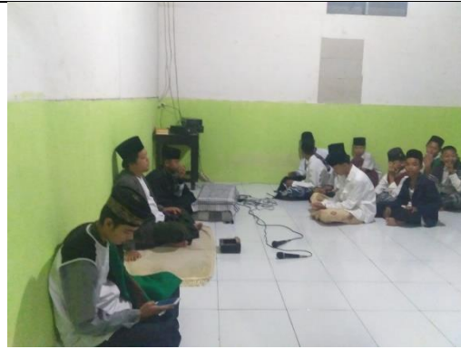
Kegiatan Pengajian Pondok Pesantren Assyafi'iyah Menggala