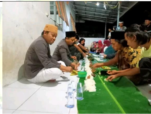
Kegiatan makan bersama para ustadz dan santri