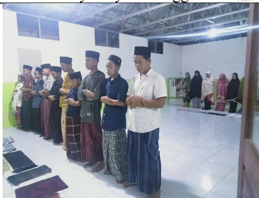
Kegiatan sholat berjamaah