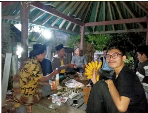
Kegiatan makan bersama para ustadz dan santri