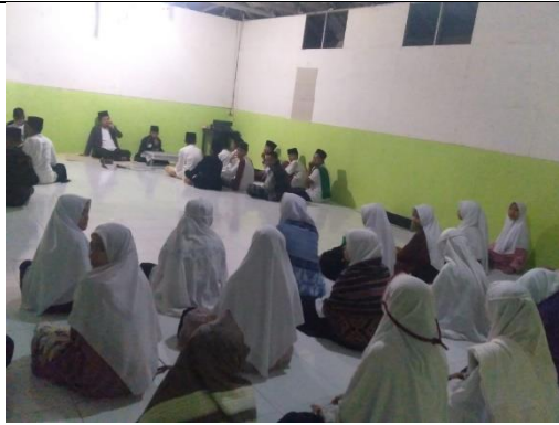
Kegiatan Pengajian Pondok Pesantren Assyafi'iyah Menggala