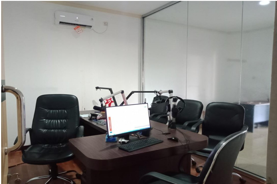
Suasana persiapan penyiar untuk on air