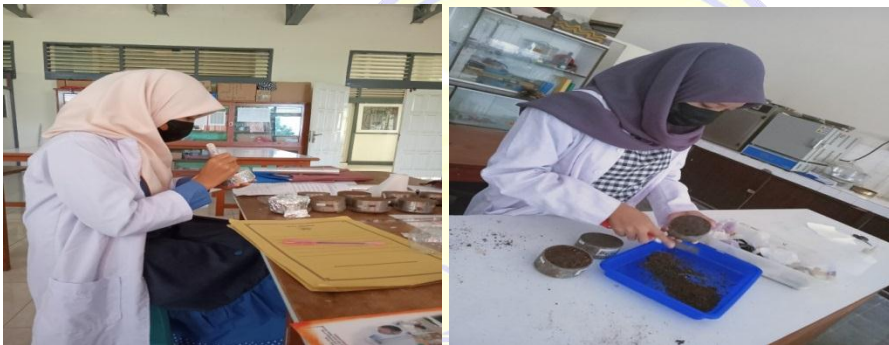
Pengujian berat volume tanah (Ring sampel) pengujian permeabilitas tanah