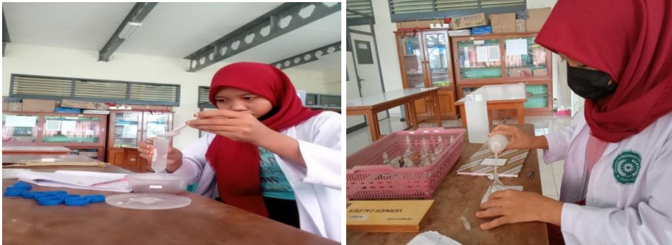
pengujian tekstur tanah (Sedimentasi) Pengujian berat jenis tanah (Piknometer)