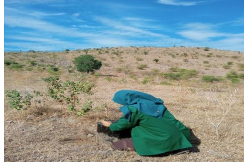
Pengukuran infiltrasi pada sawah lahan jagung Pengukuran infiltrasi pada ladang