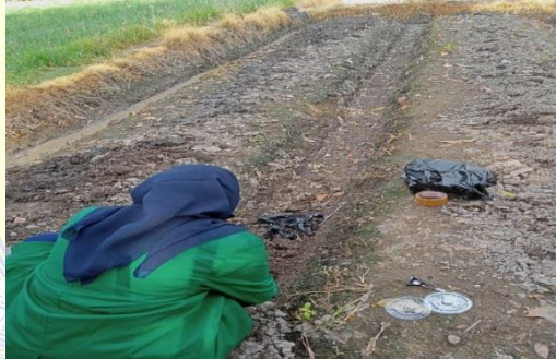
Pengukuran tingkat infiltrasi pada kebun bawang Pengukuran infiltrasi pada sawah lahan