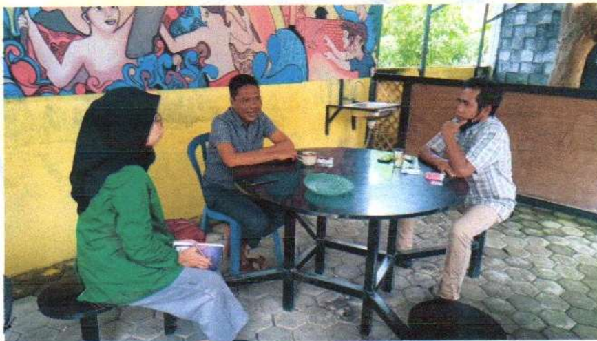
Wawancara dengan Ketua dan Anggota BUMDes