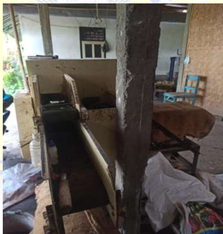
Gambaran Alat Produksi Tembakau Rajangan Virginia