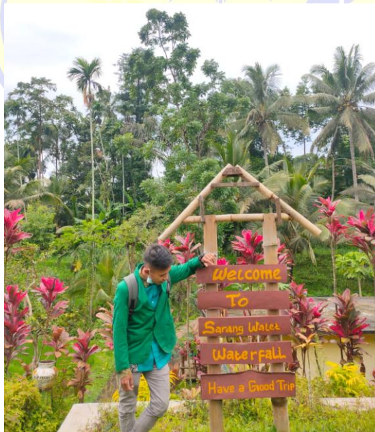
Gerbang Masuk Air Terjun Sarang Walet