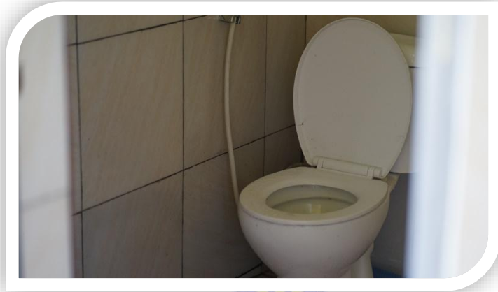
Wc Umum Areal Wisata Air Tejun Sarang Walet