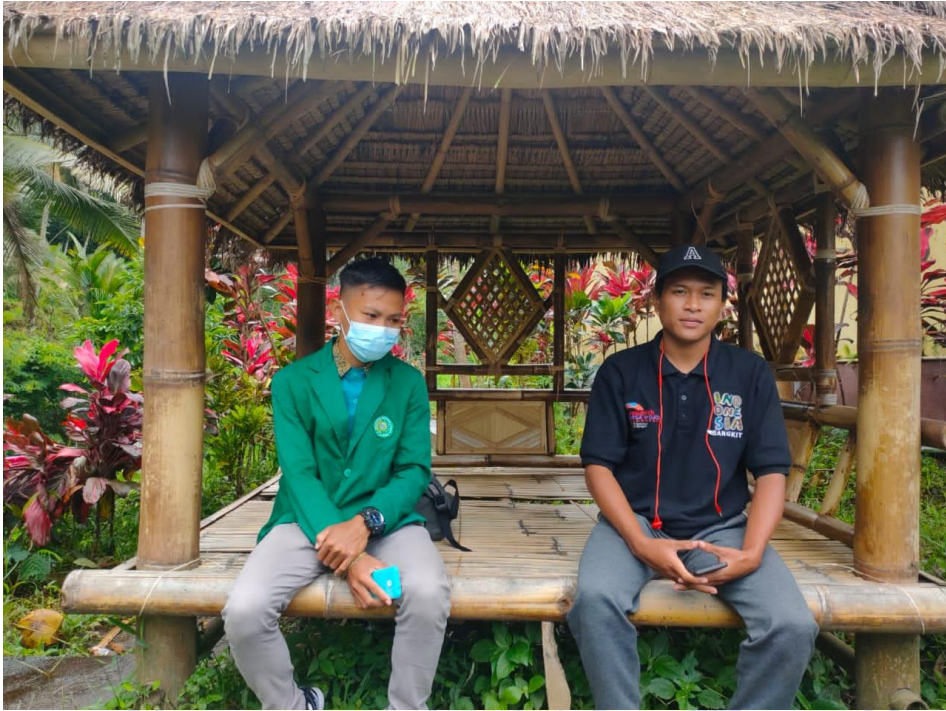
Wawancara Dengan Pengelola Objek wisata Air terjun Sarang Walet