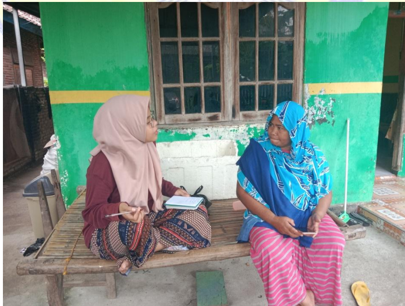
Keterangan : Wawancara dengan Pelaku/Karyawan UMKM