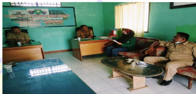
Gambar 2. Wawancara Dengan Kepala Desa Labangka