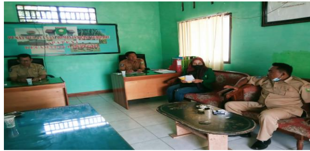
Gambar 1. Wawancara Dengan Bapak Camat Labangka