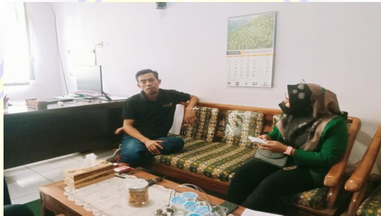
Gambar 4. Wawancara Dengan Ketua BUMDes Desa Labangka