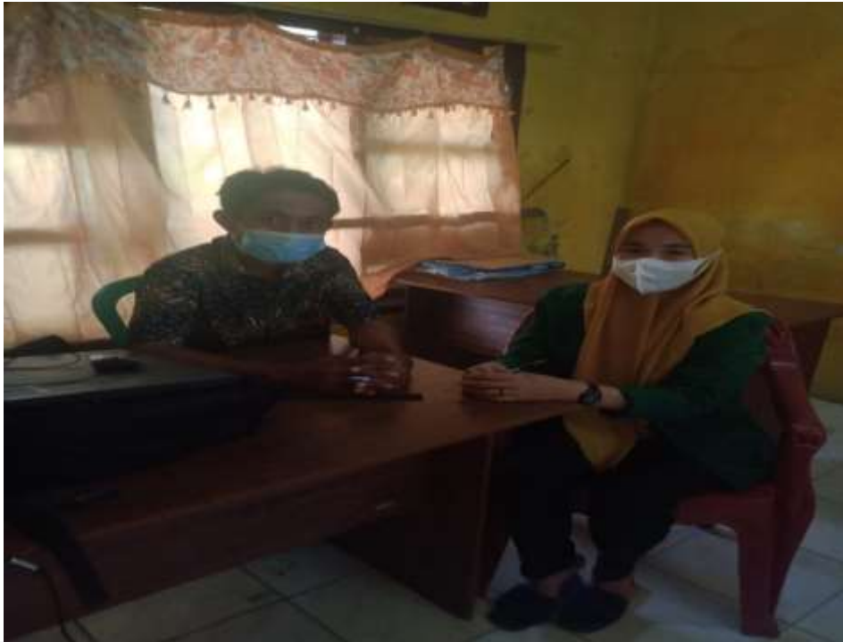
Dokumentasi 3. wawancara dengan (BPD) Desa Bugis