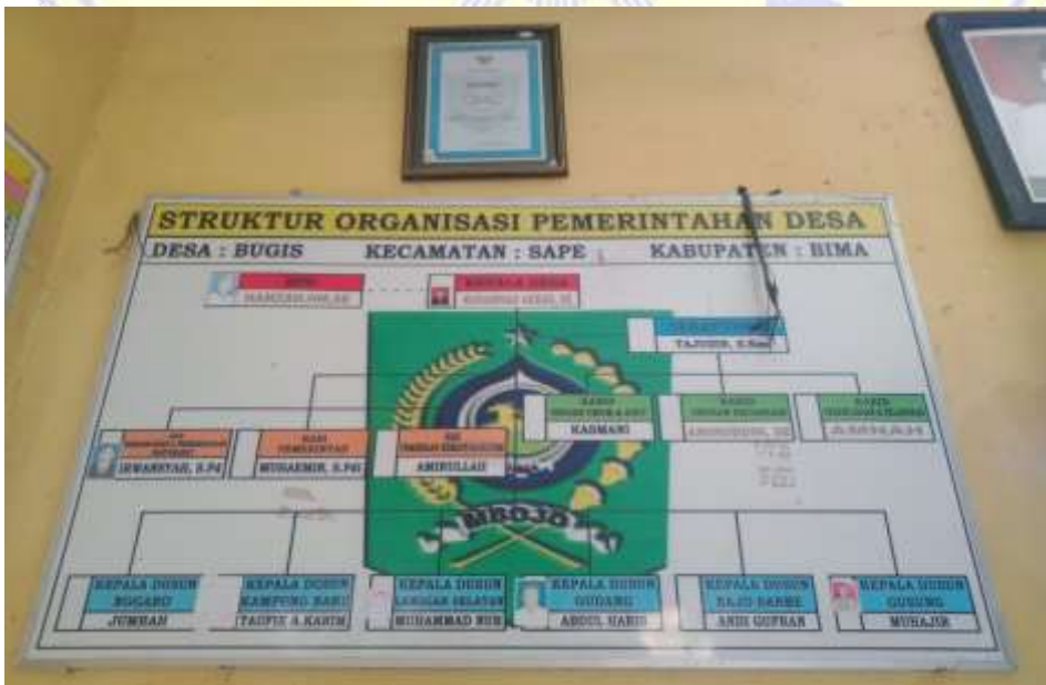
Dokumentasi 5. Gambar struktur organisasi pemerintahan Desa Bugis