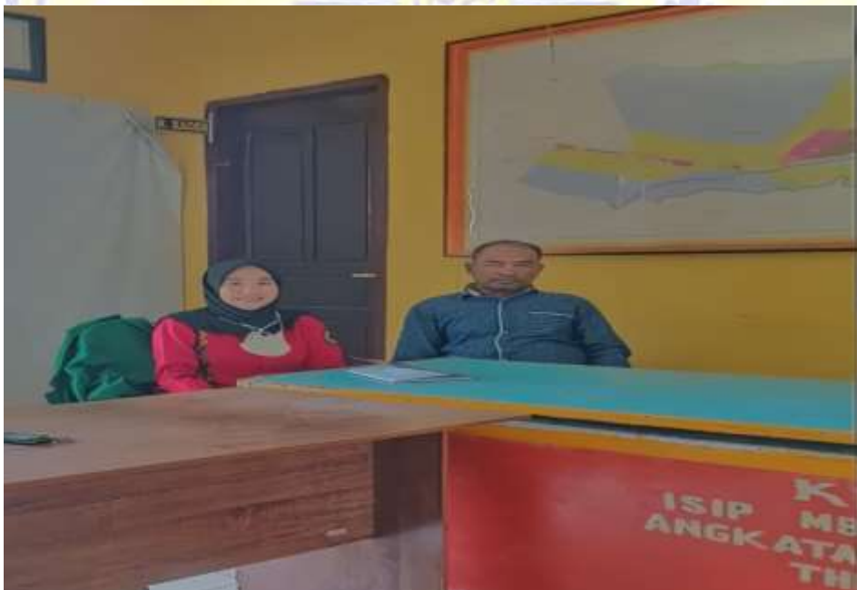
Dokumentasi 4. wawancara dengan ketua satgas covid-19 Desa Bugis