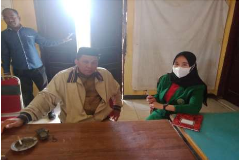
Gambar 1. Dokumentasi wawancara dengan kepala Desa Bugis