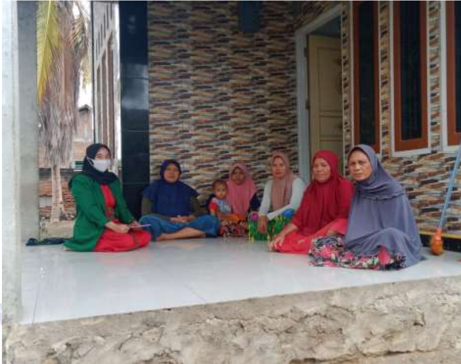
Dokumentasi 4. wawancara dengan masyarakat