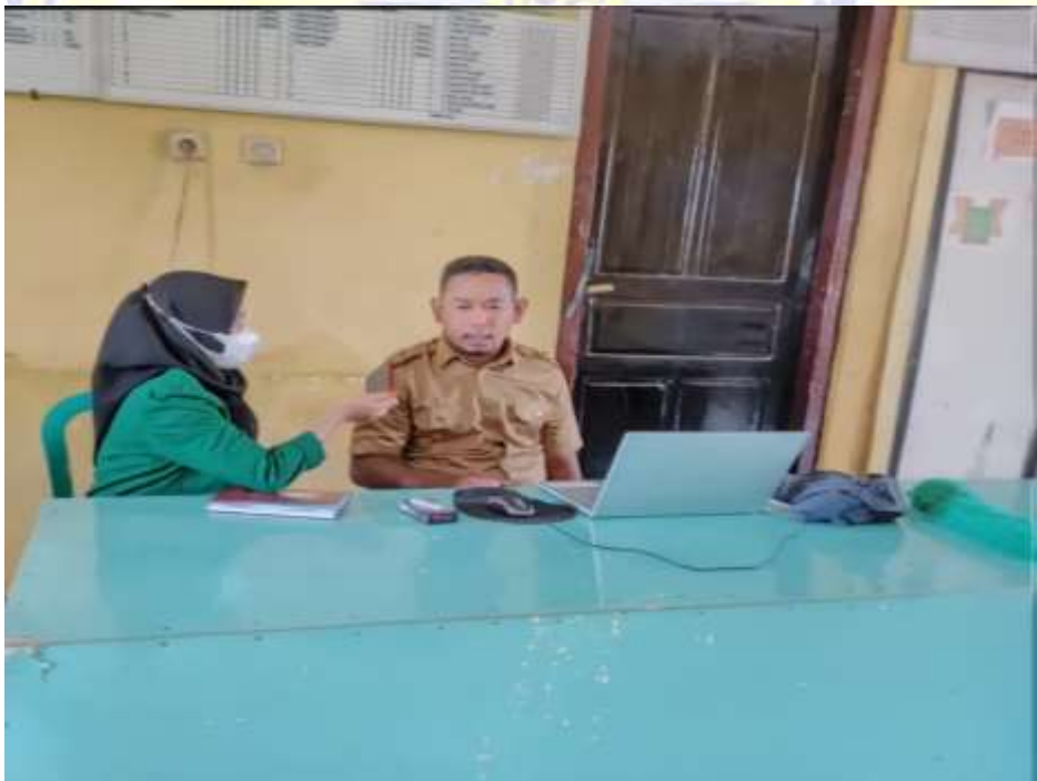
Dokumentasi 2. wawancara dengan sekretaris Desa Bugis