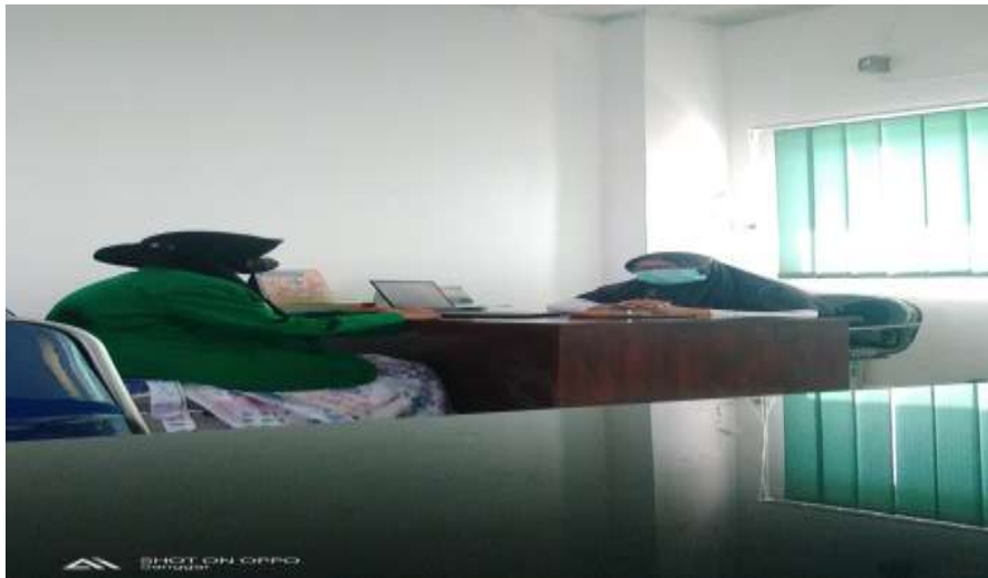
Gambar 1 Wawancara Dengan Kepala Puskesmas Sanggar