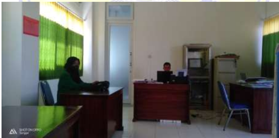
Gambar 2 Wawancara Dengan Pegawai Puskesmas Sanggar