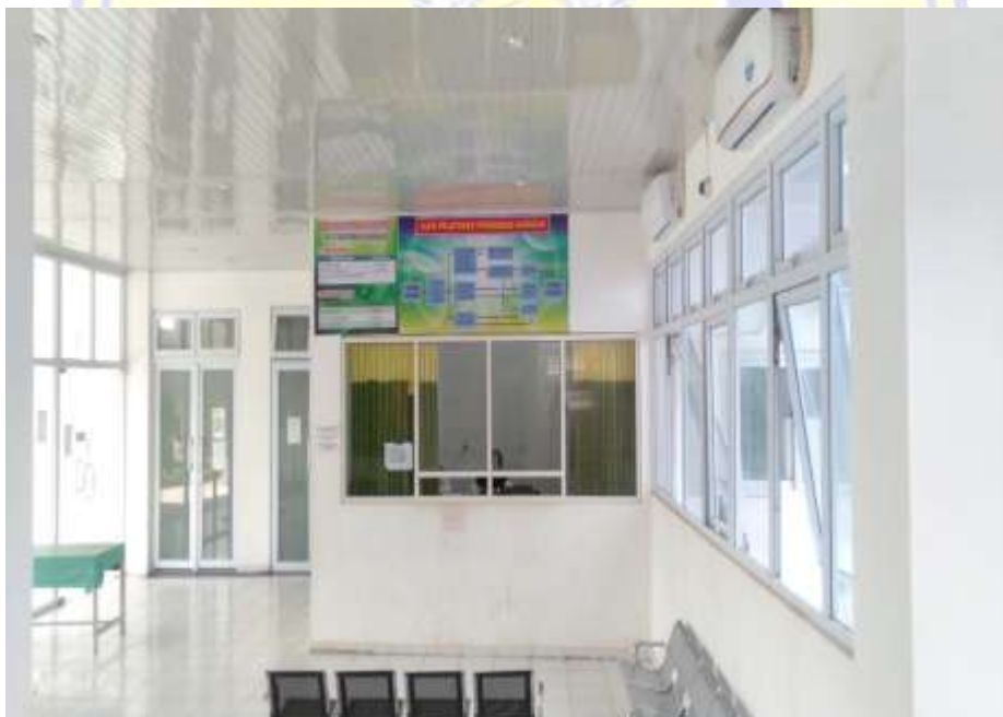
Gambar 8 Ruang Pelayanan