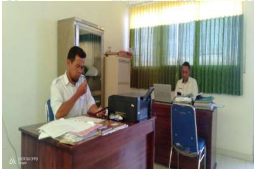
Gambar 4 Wawancara Dengan Pegawai Puskesmas Sanggar