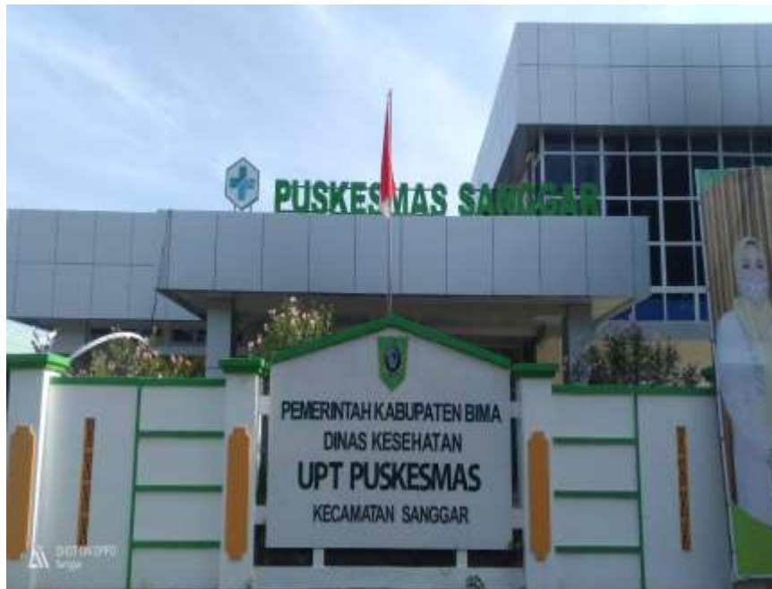
Gambar 7 Gedung Puskesmas Sanggar