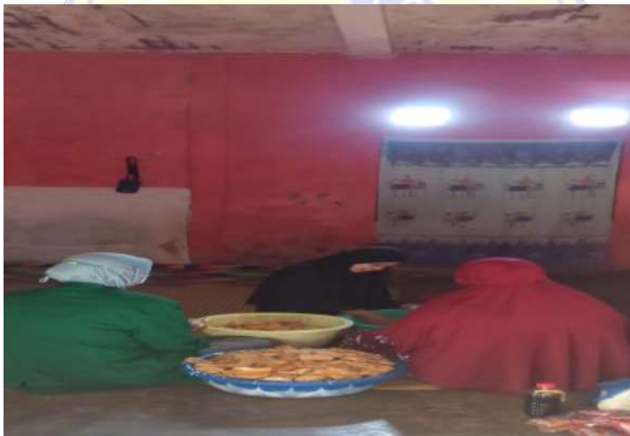
Gambar 6 Wawancara Dengan Masyarakat Sanggar