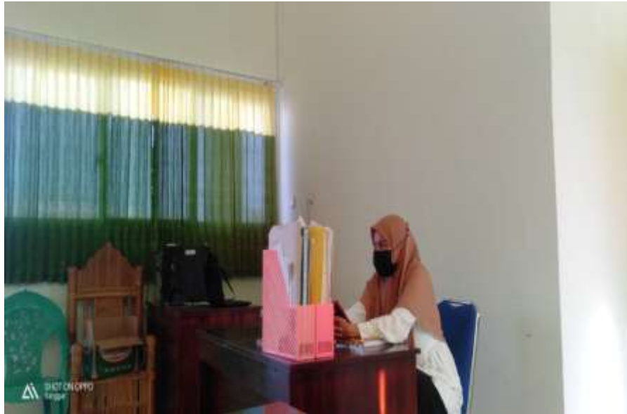
Gambar 3 Wawancara Dengan Pegawai Puskesmas Sanggar