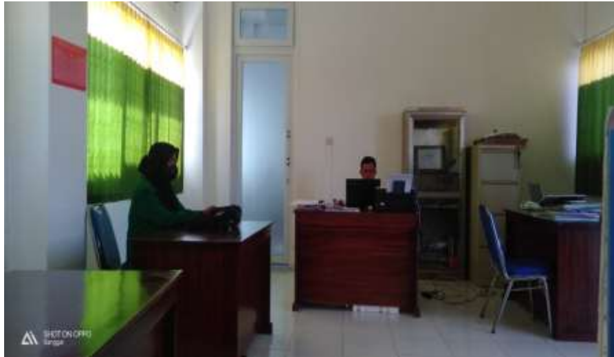
Gambar 5 Wawancara Dengan Pegawai Puskesmas Sanggar