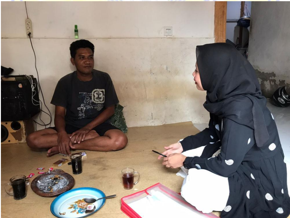
Dokumentasi wawancara bersama Ketua Koordinator Milenial Kecamatan Tanjung