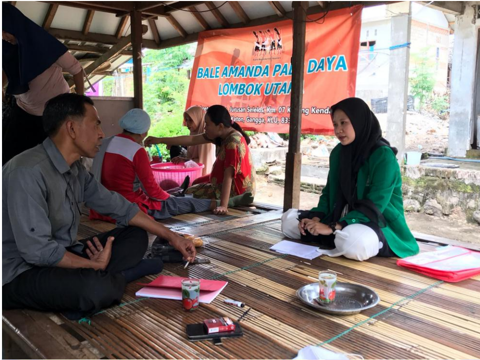
Dokumentasi wawancara bersama Ketua Koordinator Pemenangan Kecamatan Gangga