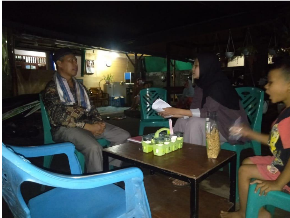
Dokumentasi wawancara bersama Ketua Tim Pemenangan dari Partai PBB