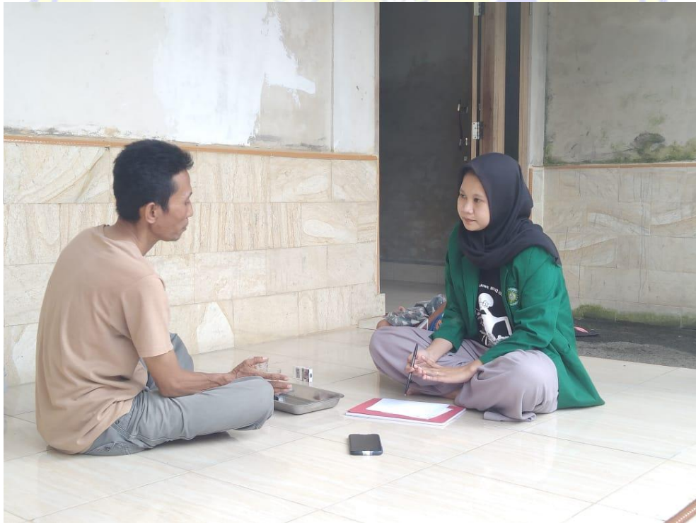
Dokumentasi wawancara bersama Ketua Tim Pemenangan dari Partai Golkar