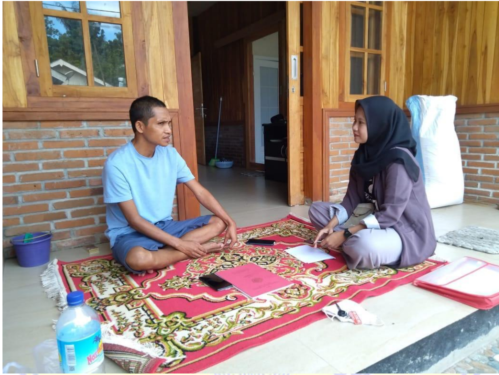
Dokumentasi wawancara bersama Ketua Koordinator Pemenangan Kecamatan Pemenang