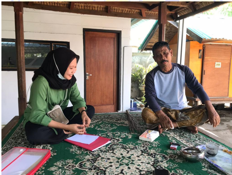
Dokumentasi wawancara bersama Ketua Tim Pemenangan Kabupaten