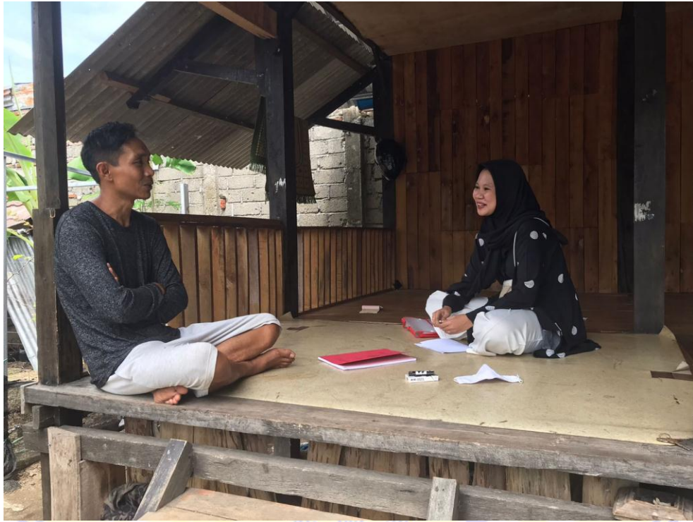
Dokumentasi wawancara bersama Ketua OKK Partai Nasdem sekaligus Ketua Tim pemenang dari partai Nasdem