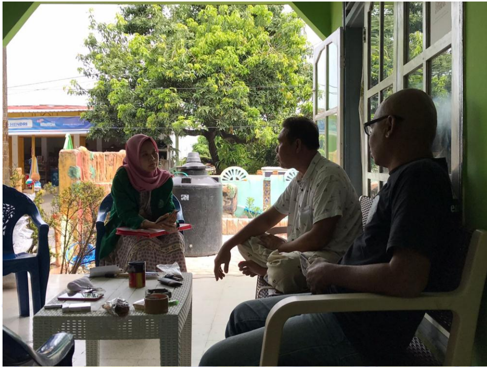
Dokumentasi wawancara bersama Ketua Koordinator Pemenangan Kecamatan Bayan