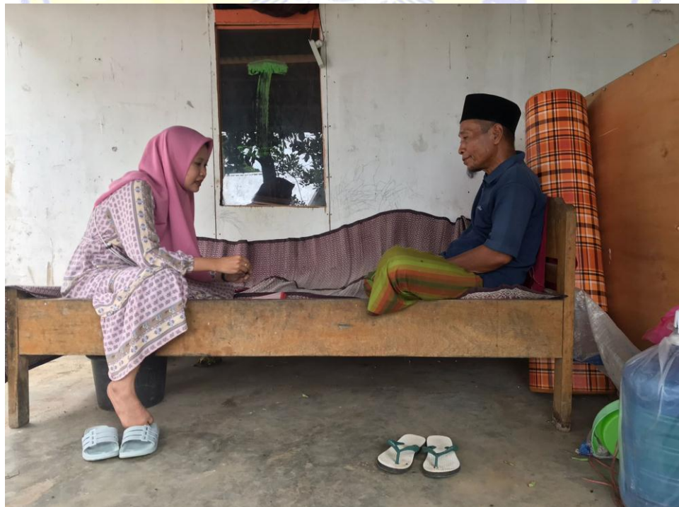
Dokumentasi wawancara bersama Relawan pemenangan Kecamatan Kayangan