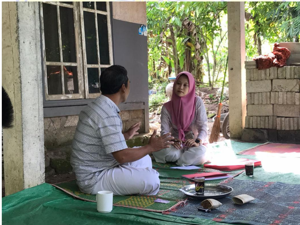
Dokumentasi wawancara bersama Ketua Koordinator Pemenangan Kecamatan Kayangan sekaligus Tim Pemenangan dari Partai PPP