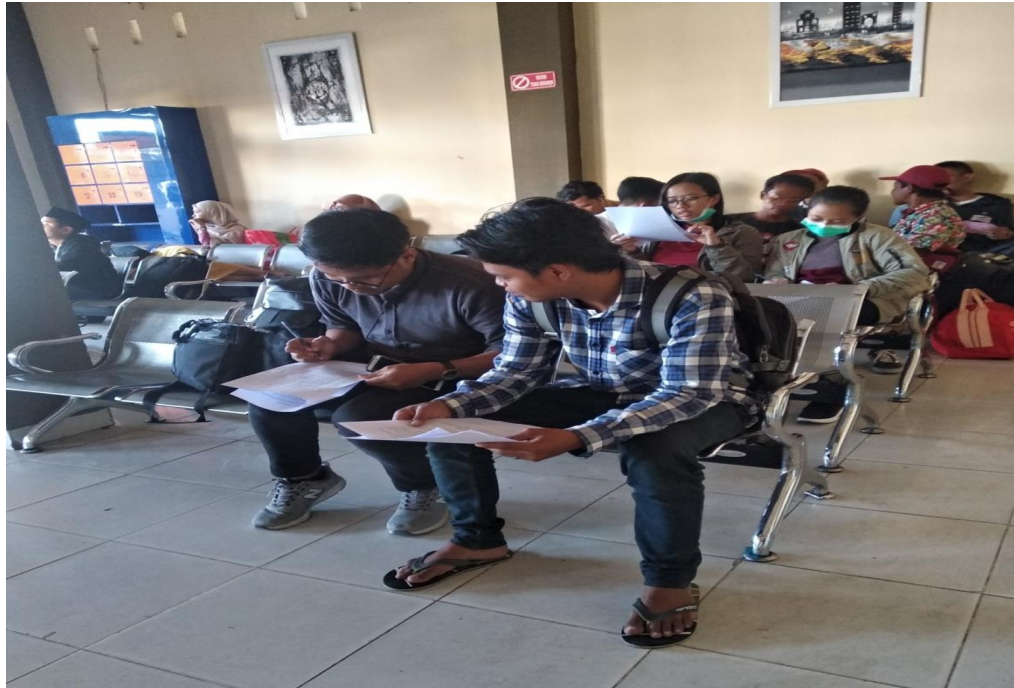
Gambar 1. Pembagian Koesioner di Terminal Pool Damri