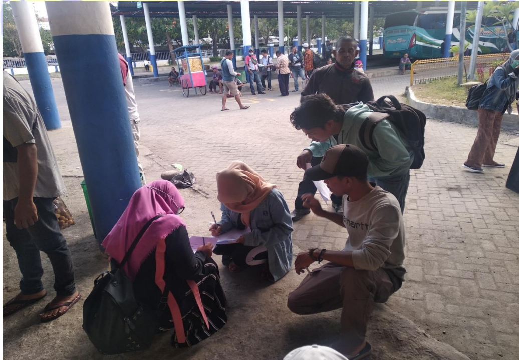
Gambar 4. Pembagian Koesioner di Terminal Mandalika