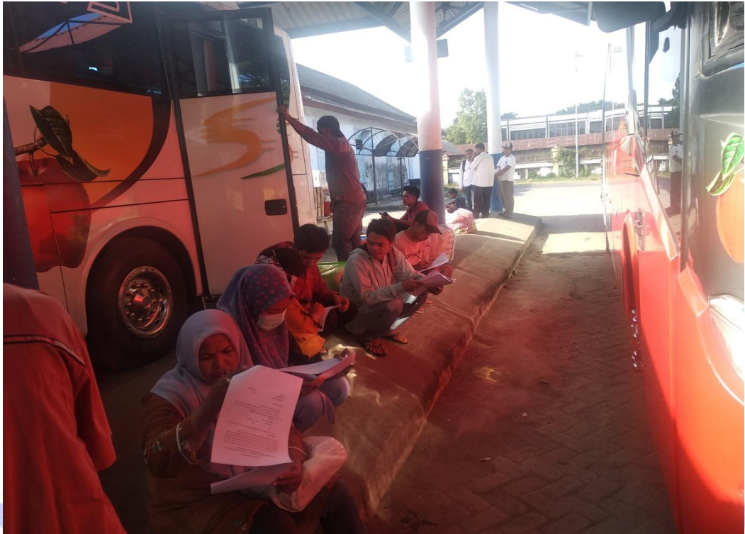
Gambar 3. Pembagian Koesioner di Terminal Mandalika