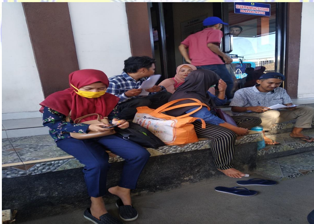
Gambar 2. Pembagian Koesioner di Terminal Pool Damri