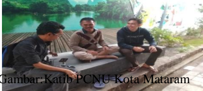
Ket Gambar: Katib PCNU Kota Mataram