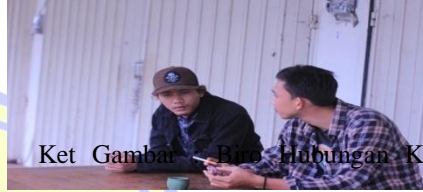
Ket Gambar : Hubungan K.A.W