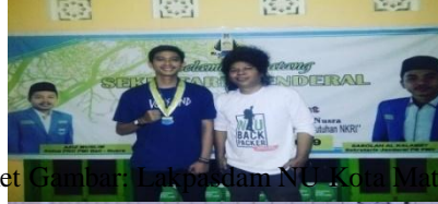
Ket Gambar: Laksdam NU Kota Mataram