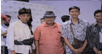
Ket Gambar : Rais Syuriyah Dan Ketua Yayasan