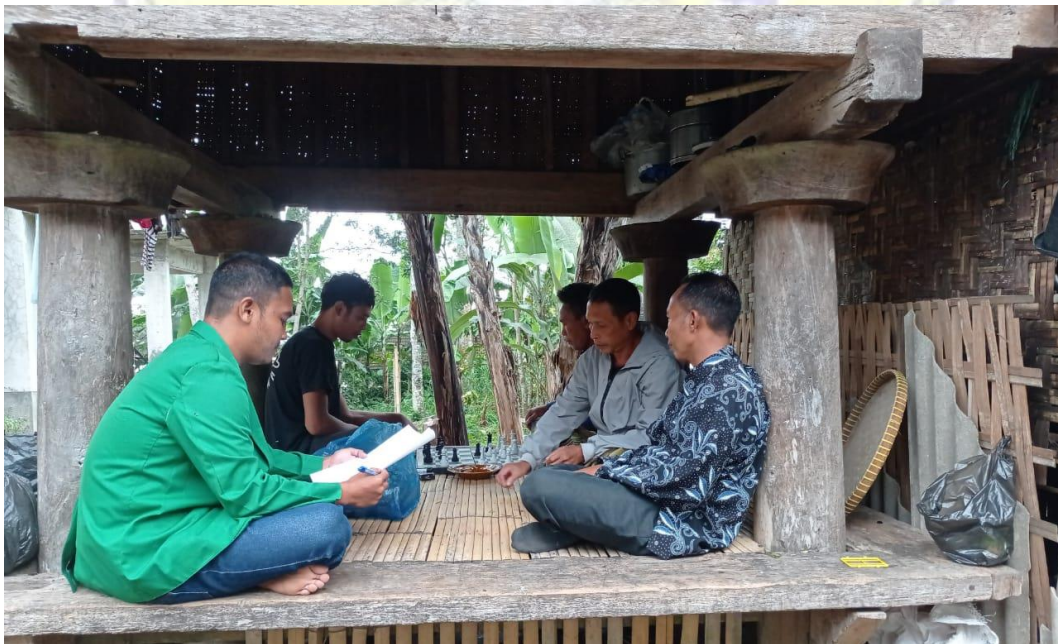
Wawancara Dengan Nelayan Lombok Timur