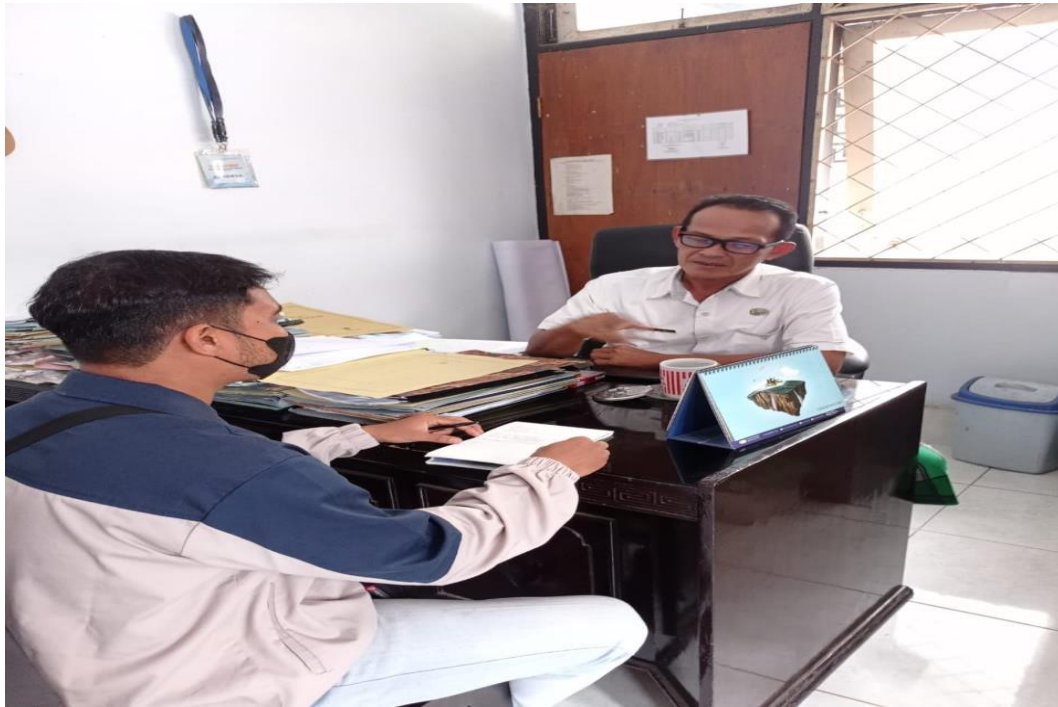
Wawancara dengan Kabid Tangkap Dinas Perikanan Lombok Timur