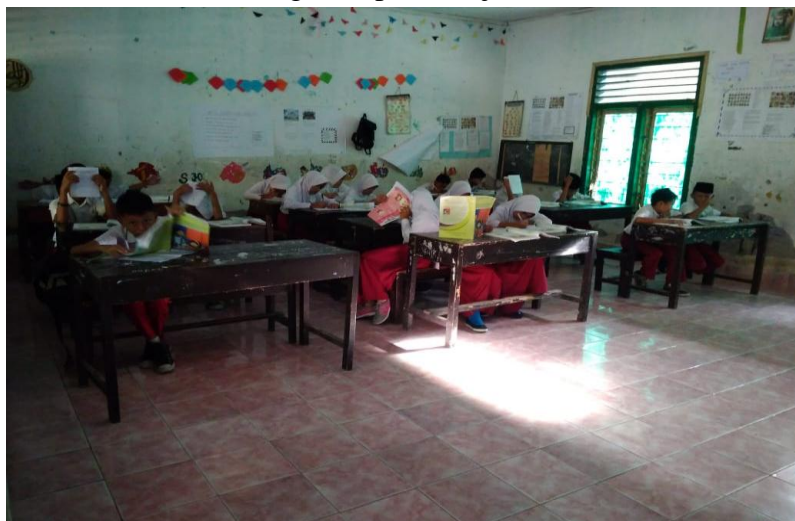
Gamba kegiatan pembelajaran siklus I