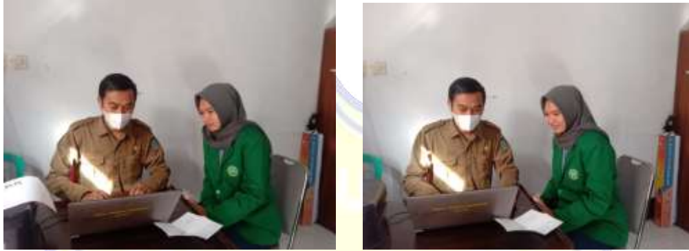
Gambar 1. Wawancara bersama kepala desa Matua