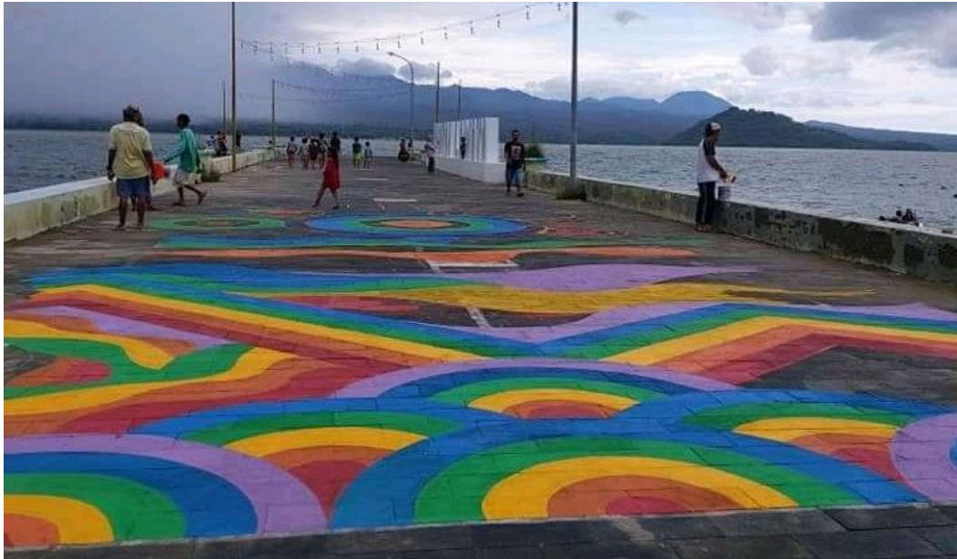
Lukisan pelangi Pantai Lawata kota Bima NTB