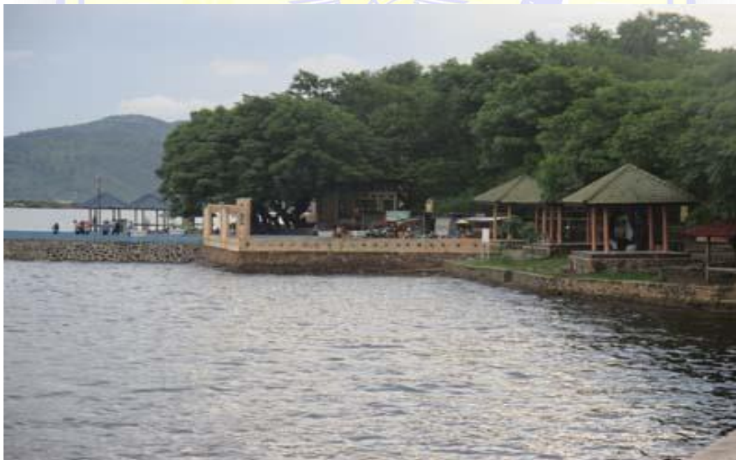
Pantai Lawata Kota Bima NTB