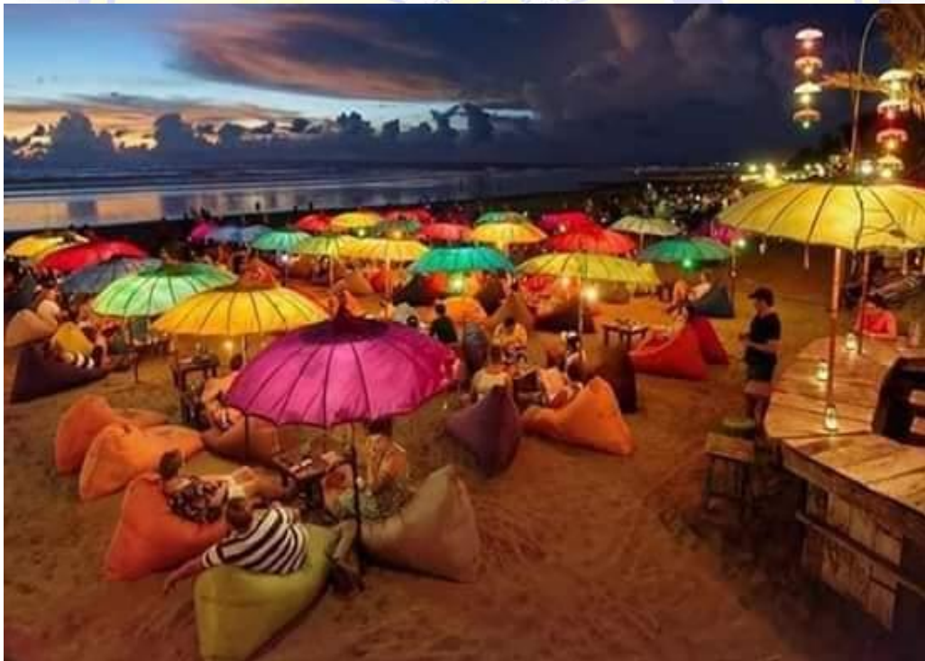
Pantai Lawata Kota Bima NTB