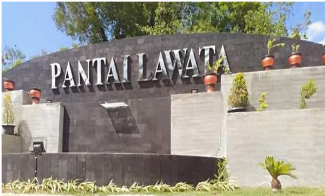
Pantai Lawata Kota Bima NTB