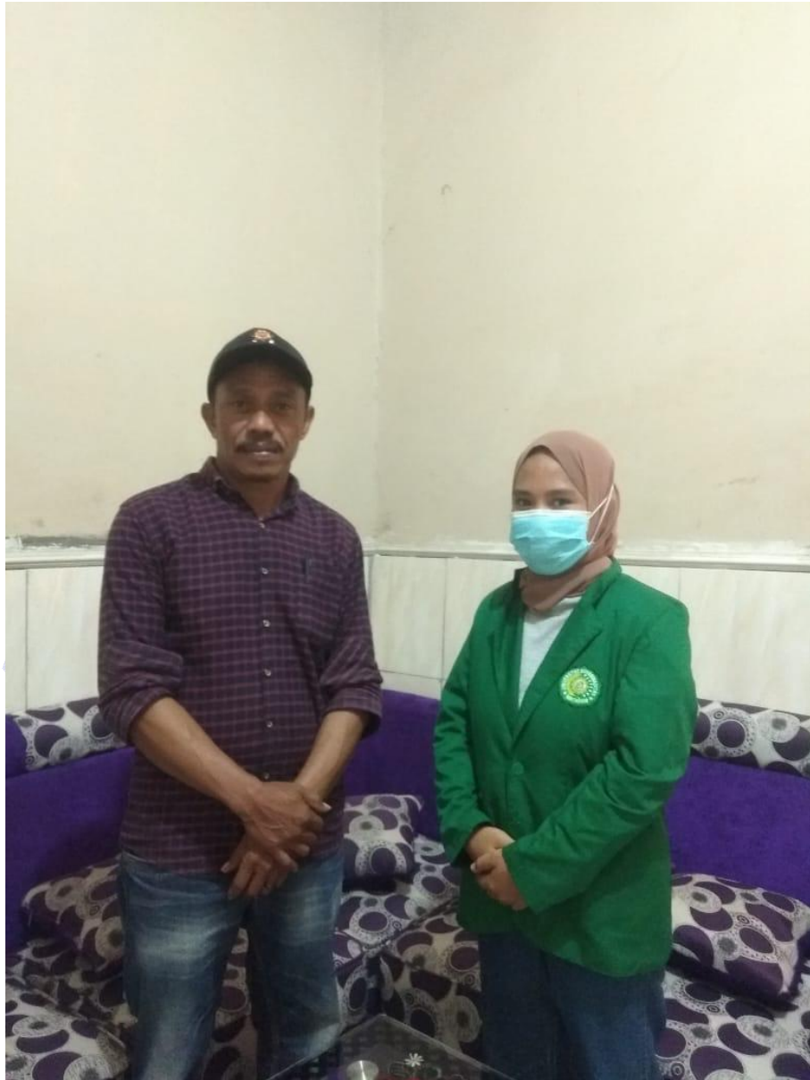
Wawancara Bersama Kepala Desa Kempo