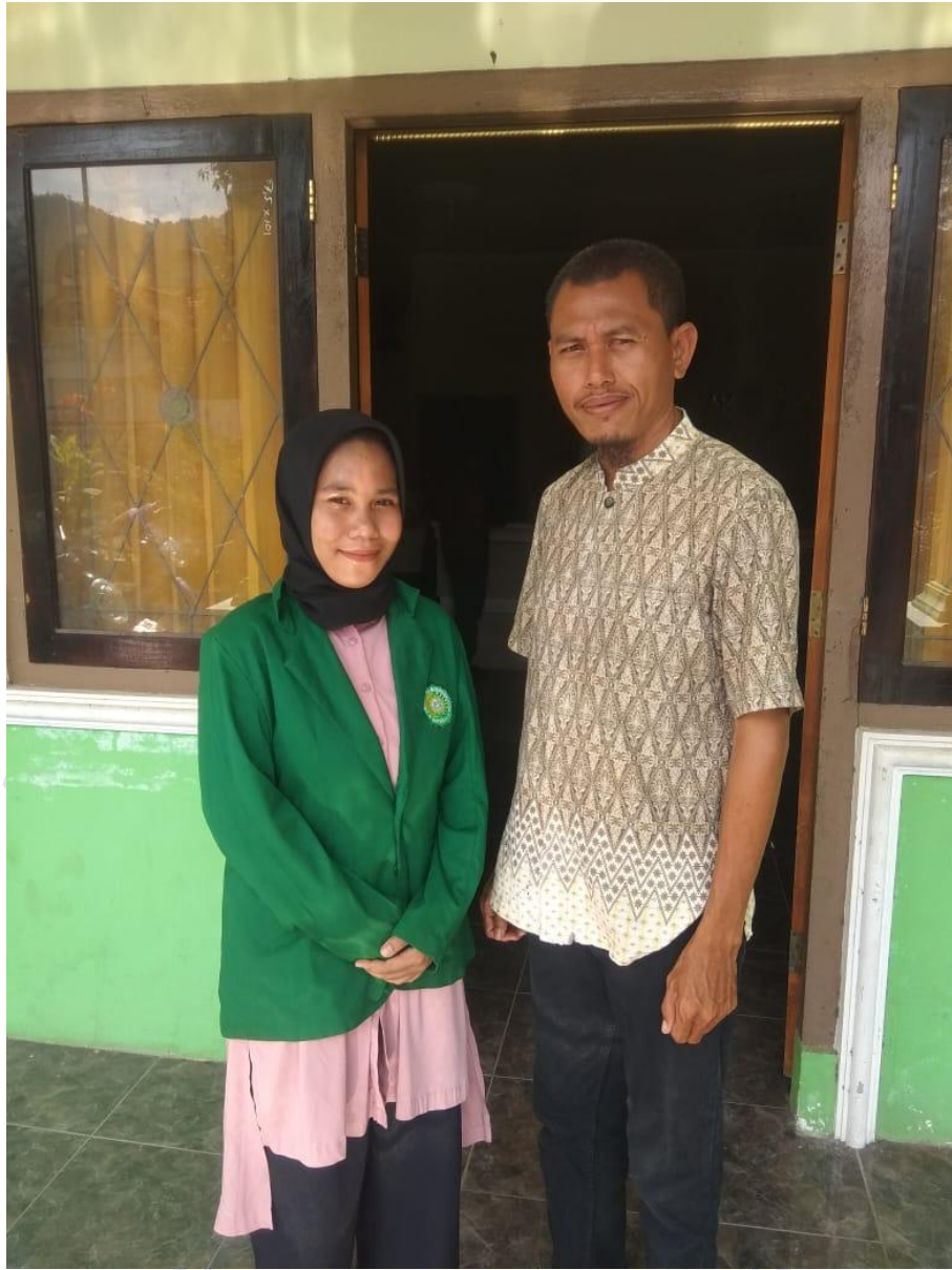
Wawancara Bersama Sekretaris BUMDes