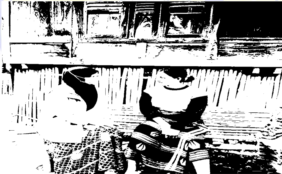
Gamabar 6 Jini Remaja