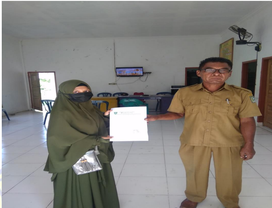
Gambar 1 Wawancara dengan Kepala Desa Wora