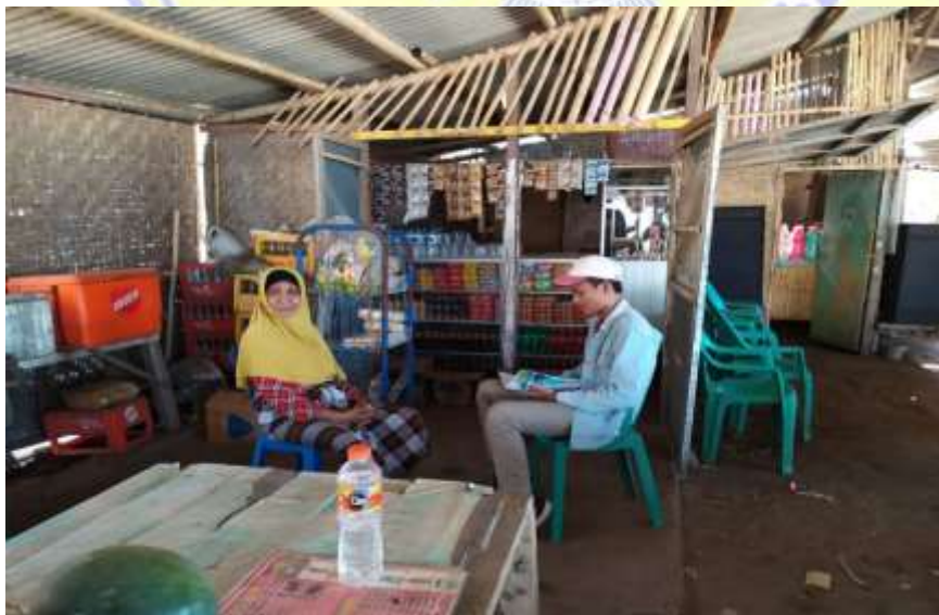
Gambar 2