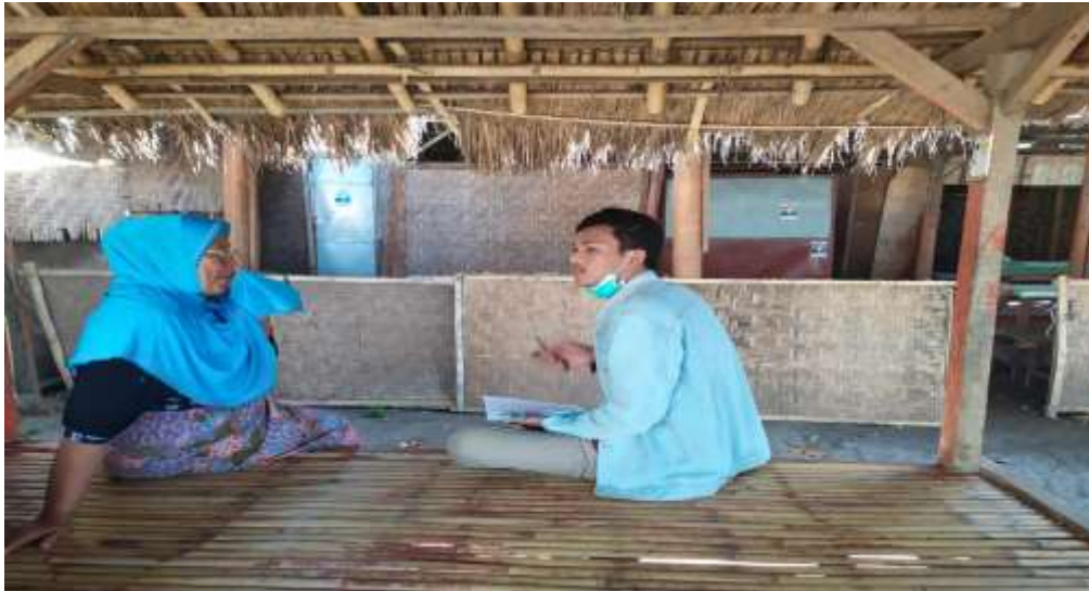
Gambar 5