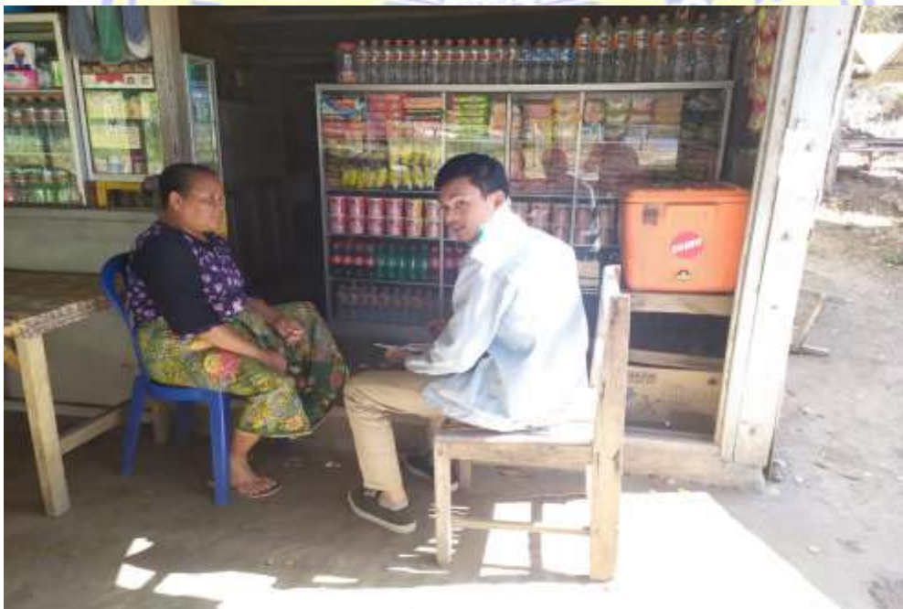
Gambar 4