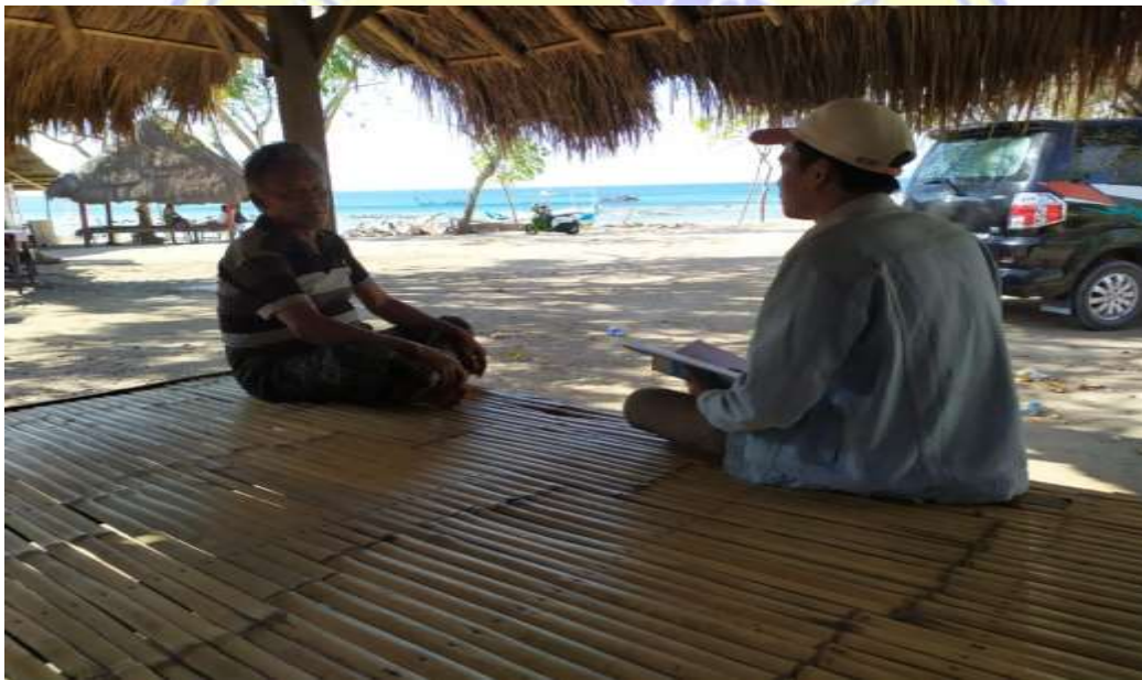
Gambar 6