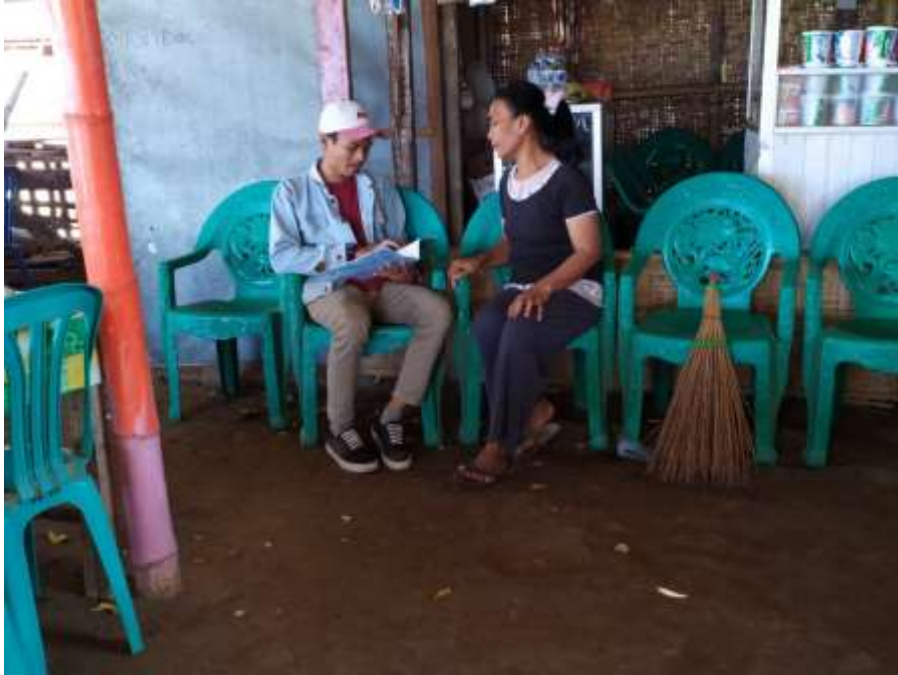
Gambar 3