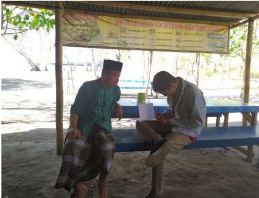
L Gambar 1