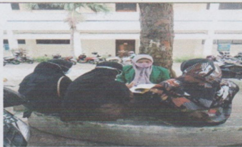
Wawancara dengan mahasiswa manggarai Timur