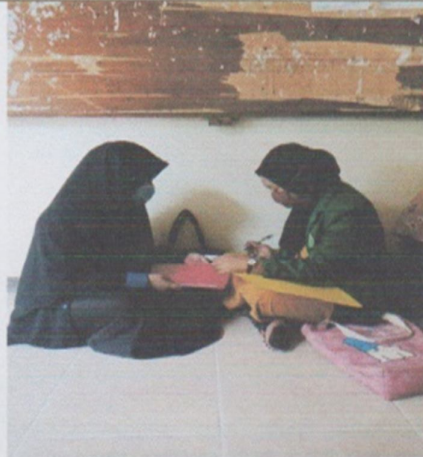
Wawancara mahasiswa Manggarai Timur