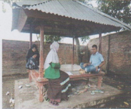
Wawancara Ketua Ikmmat