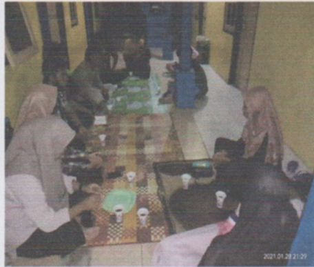
Yasinan bersama mahasiswa Manggarai Timur