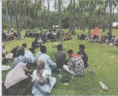
Pengkaderan anggota baru mahasiswa Manggarai Timur