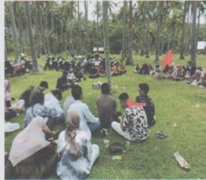
Pengkaderan anggota baru mahasiswa Manggarai Timur