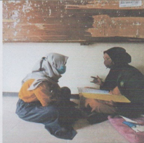
Wawancara mahasiswa Manggarai Timur