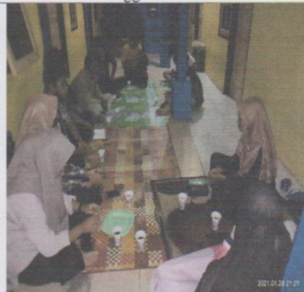
Yasinan bersama mahasiswa Manggarai Timur