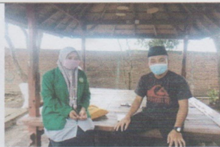
Pengantar surat ke ketua ikammat